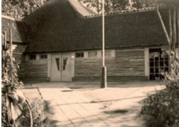
De plattegrond van de blokhut en een foto van de ingang in de noordgevel.