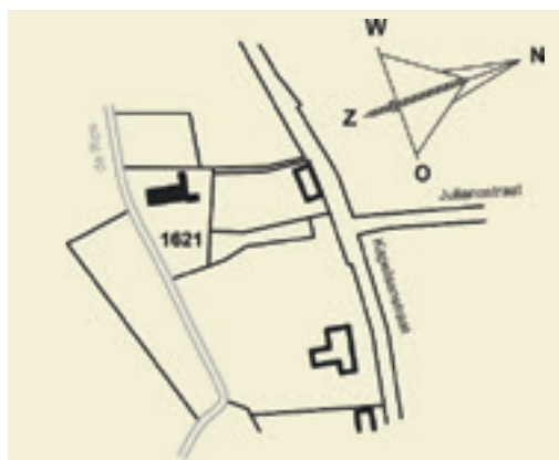
Situatieschets van de ligging van de blokhut op perceel nummer 1621.