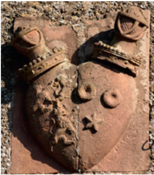
Wapenstein met rechts het wapen Von Ahr, poort van de Unterburg in Lissingen.