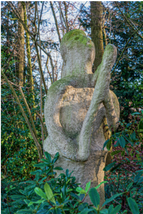
'De Harpiste' in Gemert