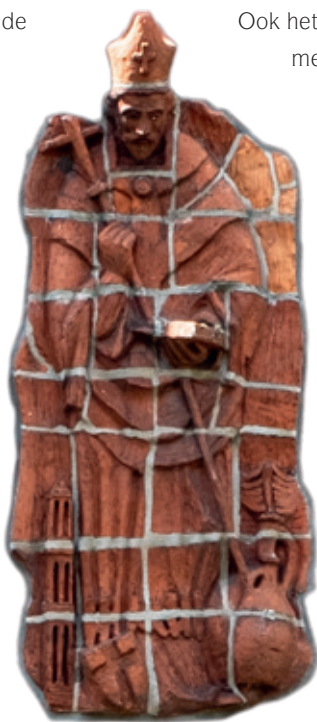
Sint-Willibrordus tegen de gevel van het Commanderie College aan de Sleutelbosch.