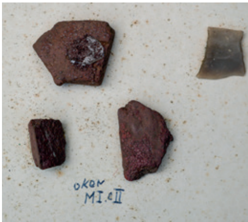
Foto linksonder: Een paar stukjes oker, afkomstig uit De Rips, aangeduid met 'oker, MI & II' wat staat voor 'Oker, Milheeze I & II'. Oker werd ook al in de prehistorie gebruikt als kleurstof.

verzameld. Later is in De Rips nog diverse keren archeologisch onderzoek door andere organisaties uitgevoerd en de vindplaats is momenteel het enige archeologische rijksmonument binnen de gemeente Gemert-Bakel. Het is de meest omvangrijke steentijdvindplaats van de provincie. 2