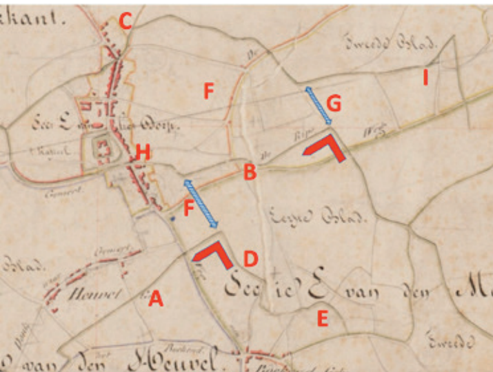
Toelichtende kaart bij de voormalige waterhuishouding in Gemert. Ondergrond is een fragment van de kadaster-verzamelkaart van Gemert van 1832.