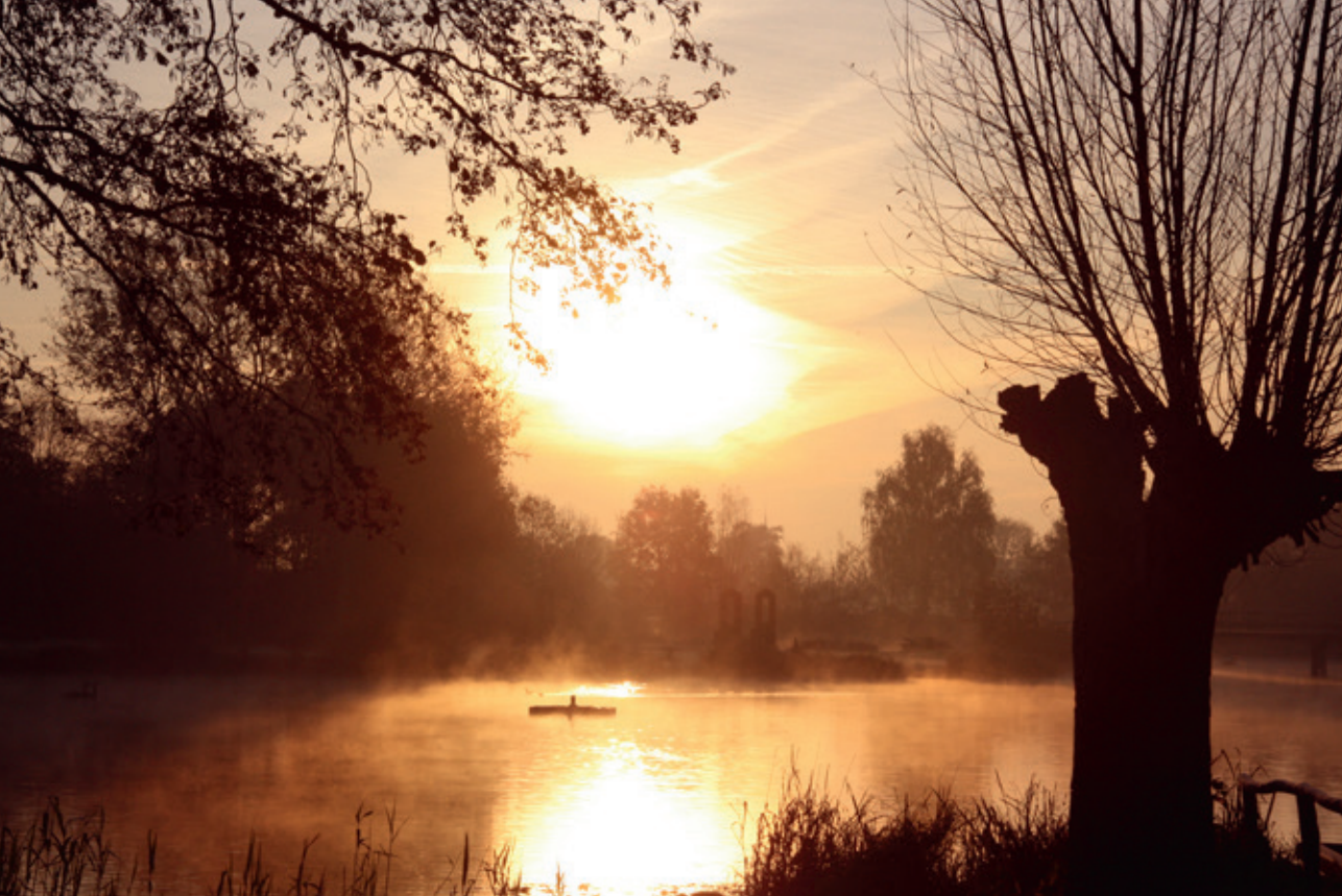
De huidige visvijver Dribbelei.

(bestuurder van een voertuig), 'drijven' van een kudde, enzovoort. Uit dezelfde basis ontwikkelde zich in het Middelnederlands ook het werkwoord dribben, met de frequentatieven 'drubbelen' en 'dribbelen' (ze duiden een herhaald springende beweging aan: dansen, springen, huppelen). De moderne vorm voor dribbelen (als voetbalterm) is via een omweg ontleend uit het Engelse woord 'dribble'. Van hetzelfde stamwoord afgeleid, in de betekenis van 'druppelsgewijs laten vallen, in kleine hoeveelheden loslaten'. Daarmee kan dribbe historisch eenzelfde betekenis hebben gehad van 'uit de grond wegdruppelen, lekken, opwellen, ontspringen' die vergelijkbaar is met de begrip-