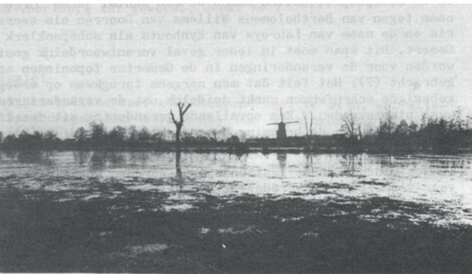
Uitzicht naar het zuiden met op de achtergrond molen de Volksvriend.