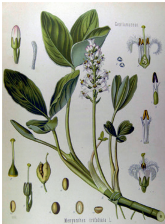
Waterdribbe of waterdrieblad ( Gentianaceae Menyanthes trifoliata L.). Bron: Köhler's Medizinal-Pflanzen in naturgetreuen Abbildungen mit kurz erläuterndem Texte , H. A. Köhler (1887)

Zoals uit de historische voorbeelden blijkt, is de betekenis van het werkwoord 'drijven' zeer breed. Vermoedelijk zal dribbe hier duiden op het snelstromende karakter van deze lei. Wat niet zo verwonderlijk is omdat alle waterlopen die dwars op de Peelrandbreuk liggen, snel stromen vanwege het hoogteverschil en het aan de bovenzijde van de breuk omhooggestuwde grondwater. Vergelijk ook de waternaam Snel-leloop en buurtschap Ren. In deze laatste naam zit eveneens een oude waternaam Ren/Run verborgen met de betekenis van 'rennen, snel stromen, hardlopen'.