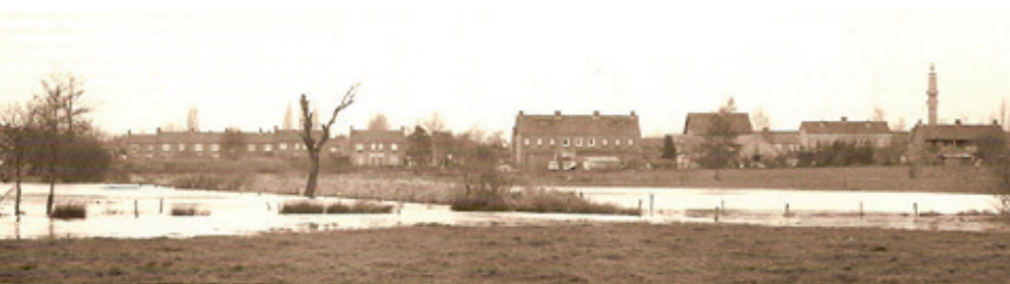
Het gebied de Dribbelei omstreeks 1976 voordat de visvijver werd gegraven (foto's: Johan Claassen). Uitzicht naar het noorden met rechts achterop de toren van de Gerarduskerk.

Historische vermeldingen zijn er al vanaf het begin van de 15e eeuw: aen der Dribbeleden