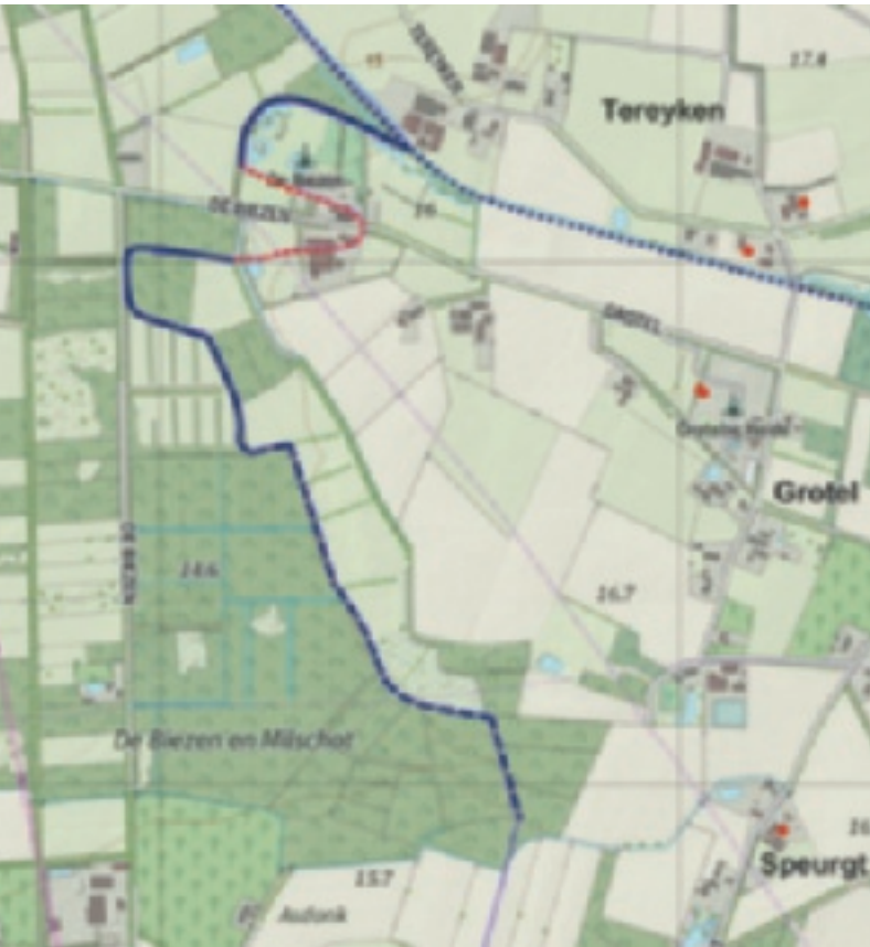
De Ymelbeke op de kaart (blauwe doorgetrokken lijn en streeplijn). Bij de rode stippellijn is de beek gedempt. Blauwe stippellijn is de Snelloep.

Het woord ymel in deze samenstelling intrigeerde mij. Wat vertelt ymel ons eigenlijk over deze beek? Deze naam was ik eerder al tegengekomen in het rapport 'De archeologie van een nat cultuurlandschap', een verslag van het veldonderzoek, uitgevoerd ten behoeve van de aanleg van het tracé PW205, nu onderdeel van de N279. De Ymelbeek wordt al genoemd in 1288: '...rivum qui vocatur Ymelbeke...' (Camps 1979, nr. 431). 2 Onze wandeling ligt ook in dit onderzoeksgebied. Het nieuwe tracé is voor ons een belangrijke verbinding