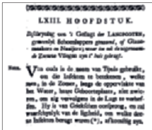
Beschrijving van het geslacht der langpootmuggen

Taalkundigen denken dat er in het Oudger-