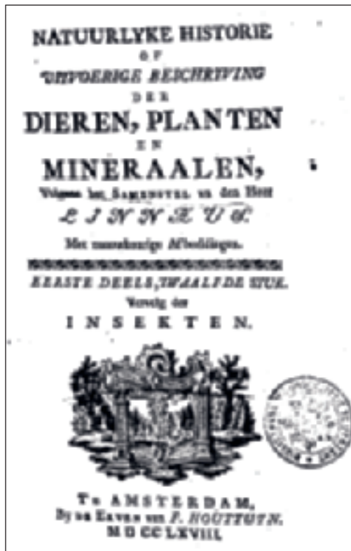
In 'De Natuurlyke Historie' van F. Houttuyn wordt al verwezen naar imme.

Het citaat waarin imme gevonden is, gaat als volgt: "Deze wormen, bij onze Visschers gemeenlyk Katjes, en ook wel Im of Immen, genaamd, zyn enz.". Deze regel is afkomstig uit een van de boeken der Natuurlyke Historie van Houttuyn [1768]. Ik heb deze verwijzing nauwkeurig