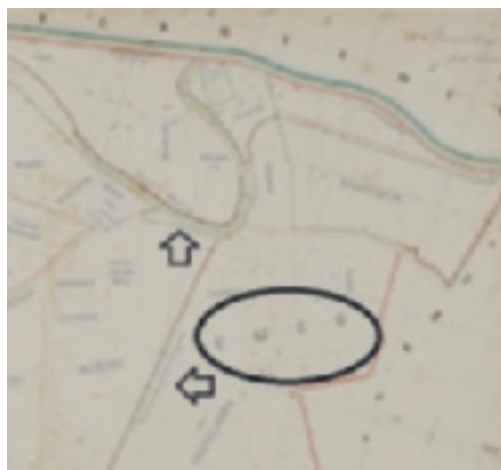
Emer toponiem aan de buitenbocht van een meander in de Oude Mark. Kadasterkaart 1824's Princenhagen, Sectie B, Kraayennest 4e blad

We hebben dus te maken met een collectief van amer . Dit element is een broertje van emer . Amer is een bekend toponiem in Erp 'ad locum dictum dem amer 1383' en Veghel 'in loco dicto den amer, ca. 1385'. De naam Amer was in Veghel in 1955 nog bekend voor moerassig land op Dorshout. 5 Verder is Emer ook een veldnaam in de voormalige gemeente Princenhage, nu gemeente Breda. 6,7 Amer en emer zijn -r- varianten van ama en ema.