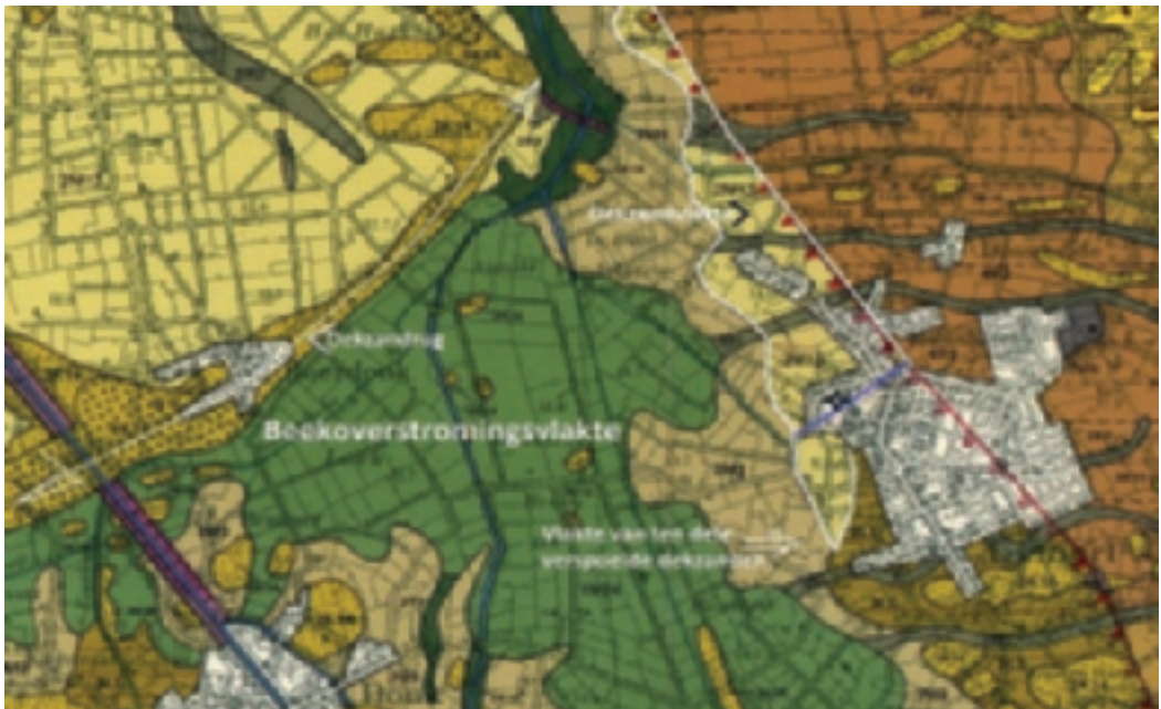
Groen gebied, beekoverstromingsvlakte (code 1M24). Kromme witte grenslijn tussen de ten dele verspoelde (code 2M9) en niet verspoelde dekzandvlakte (code 2M13). Geomorfologische kaart, Blad 51, Eindhoven, 1975.

De geomorfologische kaart van Gemert laat zien dat de Aa ter hoogte van ons dorp door een grote 'beekoverstromingsvlakte' (code 1M24) stroomt, waarin bij veel wateraanvoer zich een soort van stuwwmeer vormt. Het randgebied daarvan, de 'vlakte van ten dele verspoelde dekzanden' (code 2M9), heeft in het verleden tot