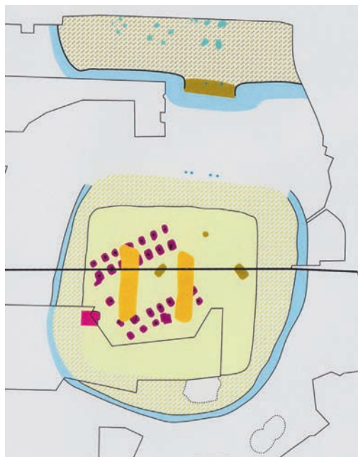
Deel van de opgravingsplattegrond van het kasteelterrein van de Heren van Gemert. De vier rijen paarse vlekken geven de paalgaten aan, waar in de periode 1050-1150 een houten zaalgebouw stond.