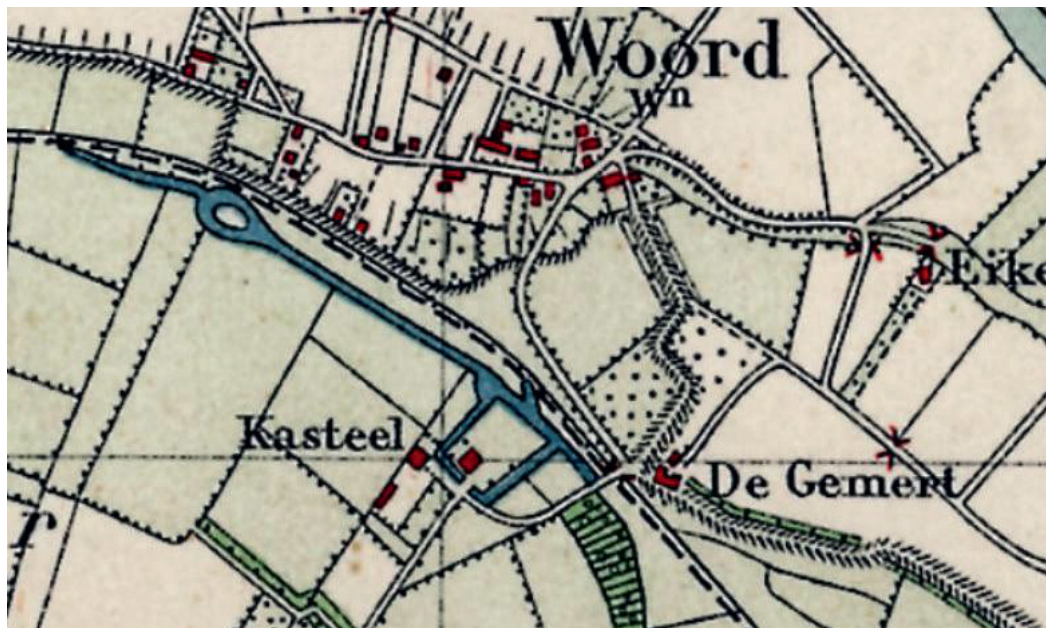
De topografische situatie circa 1940 bij het kasteel van Balgoij. De gemeentegrens volgde de oude Maasmeander en ligt tussen het kasteel en De Gamert.