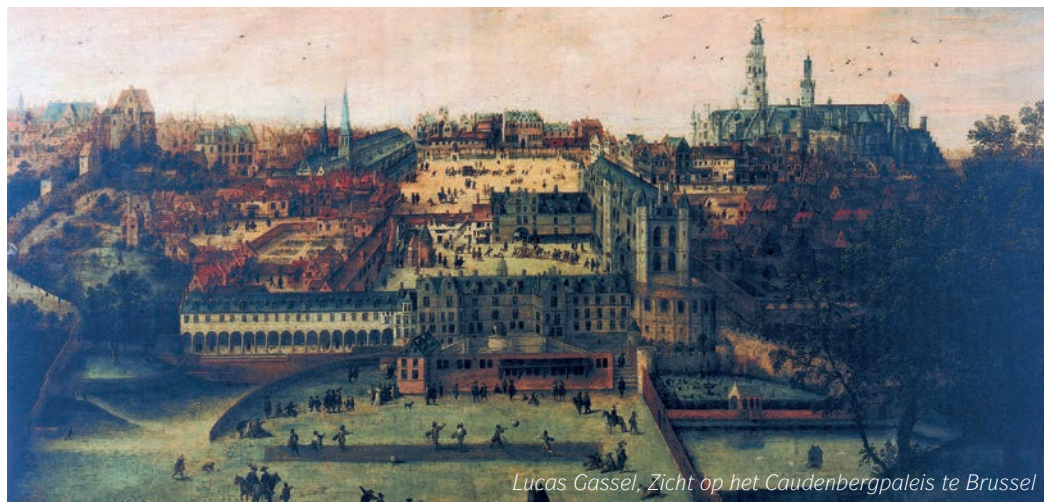
Lucas Gassel, Zicht op het Caudenbergpaleis te Brussel

en gesigneerd met zijn monogram LG . Zijn panelen vertellen veel kleine, eigentijdse verhalen. In zijn landschappen zijn talrijke anekdotes en andere verhalen verstopt. Echte zoekplaten, die het verdienen om aandachtig bekeken te worden. 8