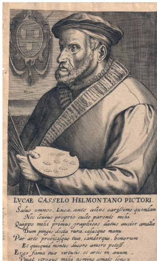
Jacob Binck, Portret van Lucas Gassel , 1529, kopergravure, collectie RKD, Den Haag.