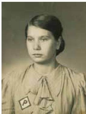
Watja als dwangarbeidster in vermoedelijk 1941. Alle Polen in Duitsland waren verplicht een 'P' op hun kleding te dragen.

Op 1 september 1939 viel Hitler Polen binnen. Mijn moeder vertelde dat ze weinig weet had van wat er in de wereld speelde, maar dat er in de stad van alles gebeurde ontging haar niet. Er liepen Duitse militairen rond in Lodz, ze zag hoe joden aan hun haren uit hun winkels werden gesleurd en ze mocht als twaalfjarig meisje niet meer naar school. Op een dag in juni 1941, ze was toen veertien jaar en alleen thuis, kwamen er SS'ers aan de deur. Ze namen haar mee en sloten haar op in een barak, samen met veel andere vrouwen. Haar moeder werd gewaarschuwd door buurtgenoten. Iedere dag ging zij naar de barak, waar de vrouwen in een