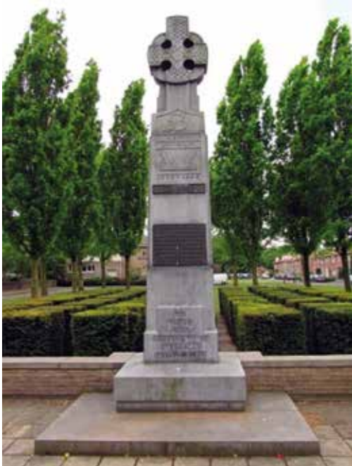
Memorial 53-rd Welsh Division

leger, terwijl de Brabantse stoters de bezetters bevochten in samenwerking met de Britten en Canadezen. Zij kregen daar het Engelse tenue, de Limburgers werden uitgerust met Amerikaanse uniformen. Allen waren te herkennen aan de naam 'Stoottroepen' op de schouder.