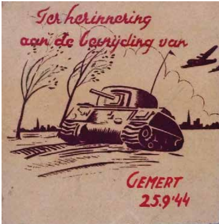
Tegeltje bevrijding Gemert