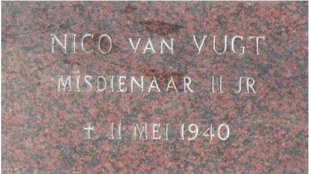
Memoriesteen in de stoep van Binderseind 2