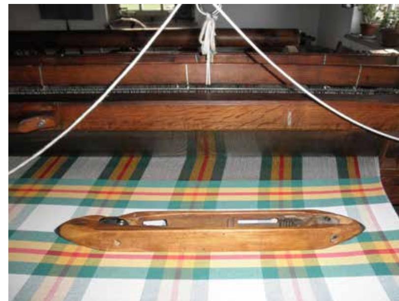
Tegelijk met de komst van de Belgische fabrikanten veranderde de weeftechniek. De weeflade met de snelspoel werd ingevoerd waarmee veel sneller én veel breder kon worden geweven. (Foto genomen in het wevershuis van het Boerenbondsmuseum - Ad Otten)

niet ontbroken, geen wever wordt ooit zonder werk afgewezen en een opdracht is ontvangen voor 12.000 stuks slingdans die binnen zes maanden geleverd moeten worden. Wat geen probleem is, want de geoefende wevers maken meestal slingdans en onder hen zijn er die drie stuks 6/4 breed en drie ellen lang per dag kunnen weven. Het loon daarvoor is 35 centen per stuk, zodat zij per dag 21 stuivers of ruim 7 gulden per week kunnen verdienen." "Geen wonder dus dat de wevers zich liever in massa aan het weefkantoor melden dan bij de oude Helmondsche fabrikanten, zoals vroeger, werk vragen. Van deze Heren waren het de Heeren Prinzen van Helmond die in