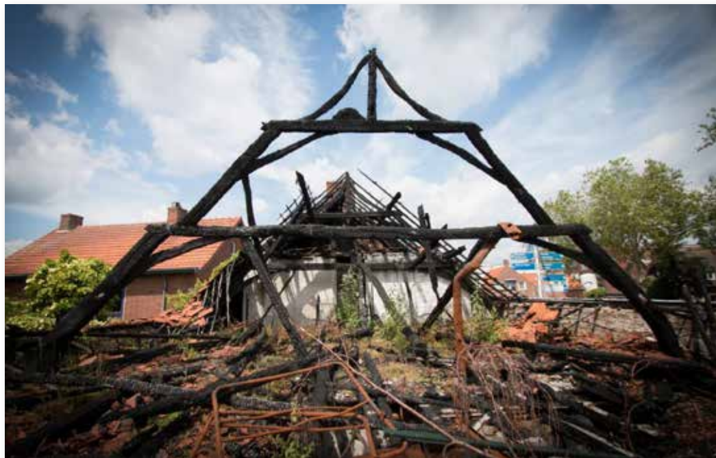
De vrijwel volledig verwoeste zolderkap van het pand Haageijk 26, met zicht op twee zwaar verkoolden spanten die uit de zestiende of eind-vijftiende eeuw zullen dateren.

Gemert-Bakel vermoedde al meteen dat het hier om een heel oud pand moest handelen. Dat zag hij aan de zogeheten 'krommers' in de kapconstructie, die na de brand geblakerd en al boven de ruïne uit bleven steken. Het betreft constructiemateriaal van gekromd