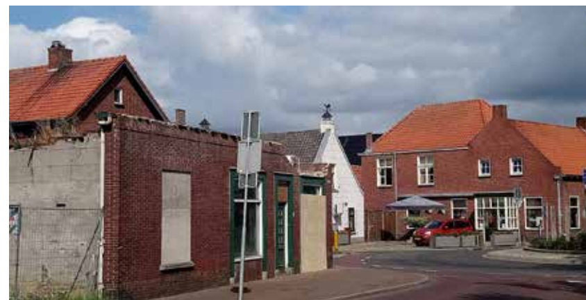
Het pand Haageijk 26, anderhalf jaar na de ruïneuze brand. (Foto Ad Otten, 7 juli 2019).

verwerft. Bij de gemeente liggen inmiddels al plannen voor onder meer een grote supermarkt op deze locatie. Een paar dagen voor het krantenbericht in het ED 6 verschijnt 'dat het ruïneuze pand van vroeger Bronneberg om veiligheidsredenen snel zal moeten worden gesloopt' valt bij het gemeentearchief het in dit artikel besproken BAAC-rapport in de brievenbus.