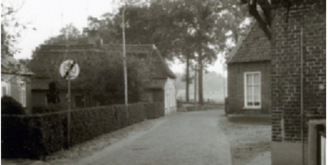
Helemaal links is nog juist de in 1948 nieuw gebouwde weverij zichtbaar waarvoor Jaspert in 1959 vergunning krijgt om die te verbouwen tot woonhuis, foto ca. 1960. (GAG 19_077)