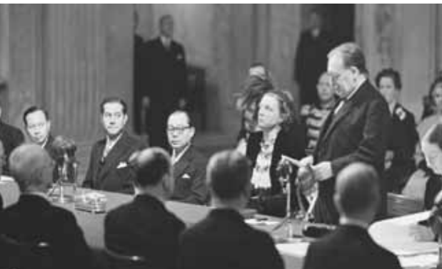
Na de soevereiniteitsoverdracht ontstaat de Republiek Indonesia

rugkeren, hoewel het overal onrustig blijft en er nog dagelijks soldaten sneuvelen. Pas eind 1948 kan pastoor Thomas aan zijn moeder melden dat het wat rustiger is geworden, ondanks de tweede politionele actie van 19 december 1948 tot 5 januari 1949. Deze wordt echter voornamelijk uitgevochten op Oost-Java. De stad Buitenzorg blijft dankzij zware bewaking letterlijk en figuurlijk buiten schot.