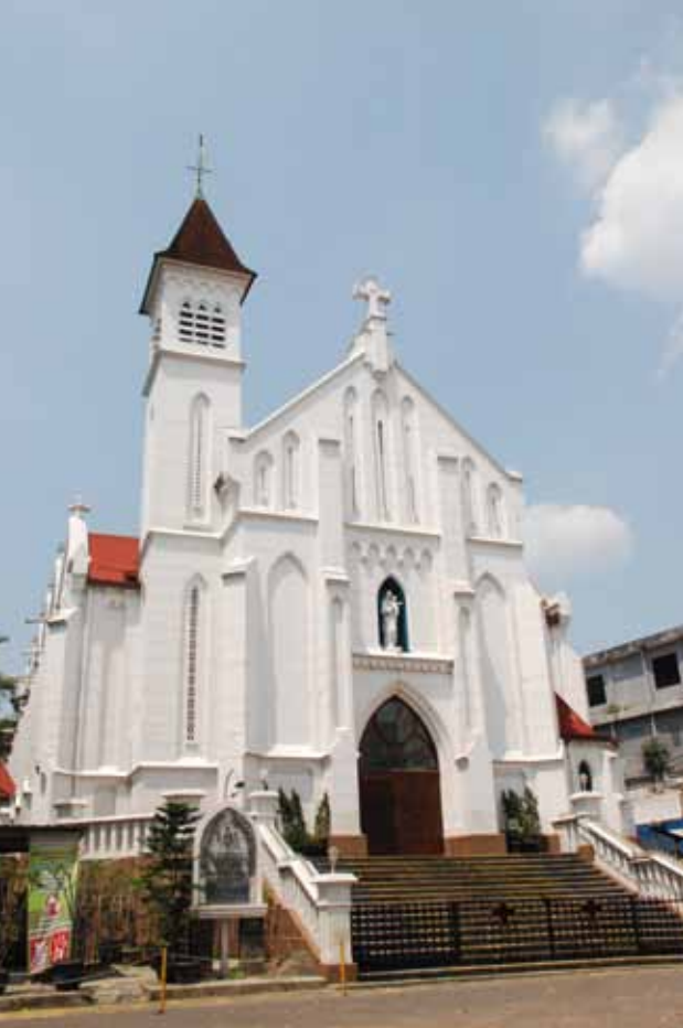
De kerk in Bogor