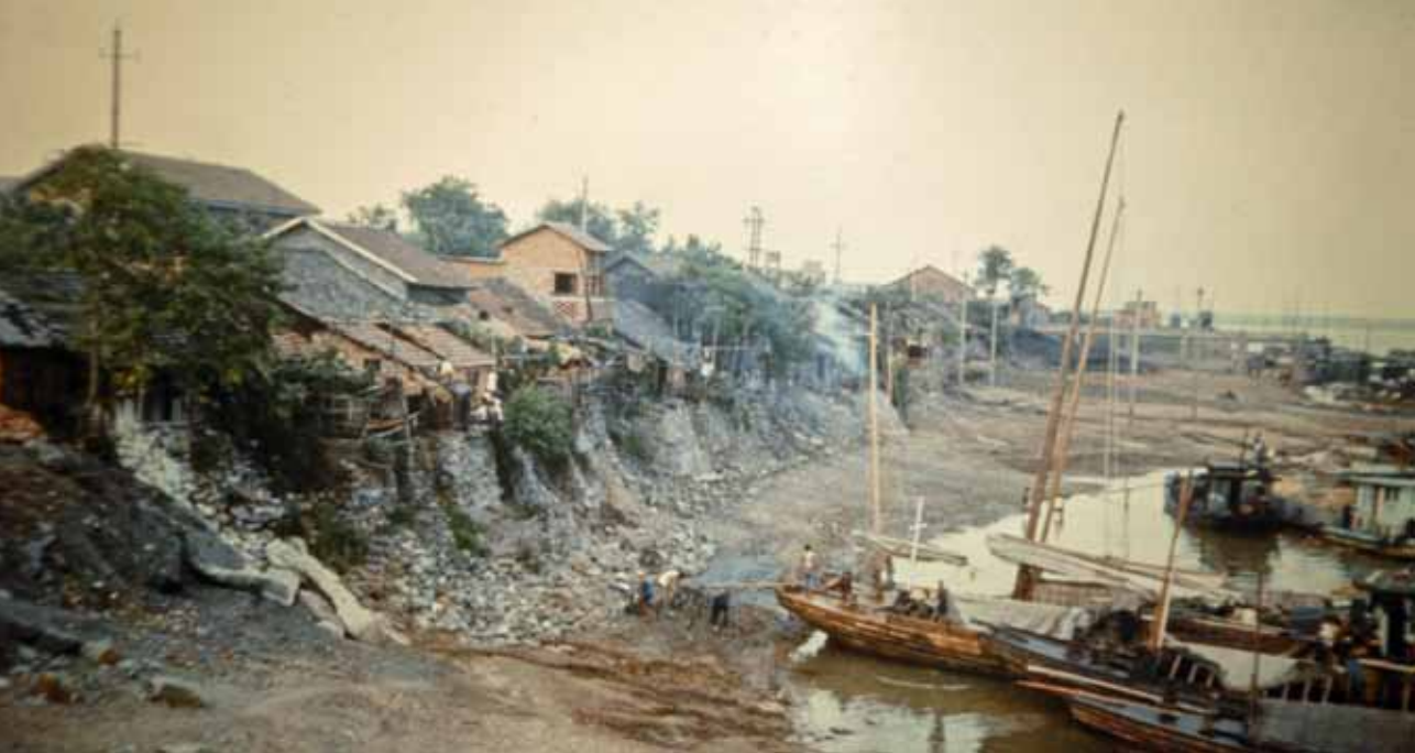
Het leven langs de rivier in China.

zeker niet uithouden. Vanwege de vochtigheid heerst hier overal de malaria. Reeds tweemaal heb ik te bed gelegen, met een koorts tot boven de 40 graden. Het is onderhand zes jaar geleden, dat ik nog hollands gesproken heb, doch zijn moedertaal vergeet men niet gemakkelijk. Levend temidden van zoveel gevaren, ontmoet ik soms in vier maanden tijds geen andere missionaris. Het reizen is hier iets verschrikkelijks. Stel u de bedding van een bergrivier voor, vol met grote stenen en keien, dan heeft u een beeld van onze wegen.