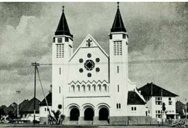
De katholieke kerk van Malang

In het over het algemeen broeierig klimaat van Indonesië is het in Malang redelijk goed toeven. Niet voor niets worden verzwakte kinderen voor drie weken naar speciale kindervakantiekolonies in dit bergstadje gestuurd om van de koelte te genieten en weer op krachten te komen. Nou ja stadje, zeg maar gerust stad. In 1930 wonen er 70.662 Indonesiërs, 7.832 Chinezen, 693 overige vreemde oosterlingen en 7.463 Europeanen. In totaal telt Malang bij de komst van zuster Martha en haar collega's dus zo'n 86.650 inwoners. Dat is best veel als je dat vergelijkt met Nederlandse steden van toen. Eindhoven heeft dan 94.948 inwoners, 's-Hertogenbosch 42.203 en Tilburg 78.804. Steden als Arnhem, Apeldoorn, Maastricht en Nijmegen zijn beduidend kleiner.