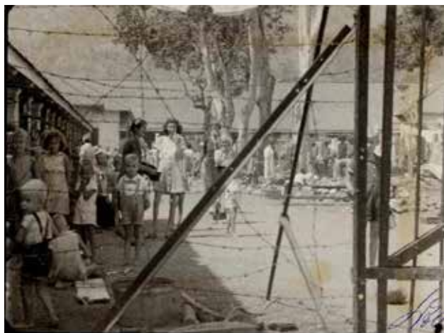
Japans vrouwenkamp Banjoebiroe

De situatie is levensbedreigend. Een Javaanse priester die pro-Nederland is, wordt doodge-marteld. De schrik zit er goed in. Het is menens. Op last van de bisschop worden door moeder overste snel de laatste geconsacreerde hosties uitgereikt. Op een na. De zusters willen de Heer dichtbij zich houden.