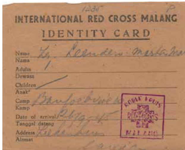
Identiteitskaart van het Rode Kruis