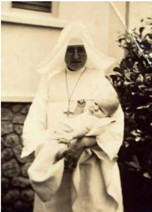
'De ooievaar is onlangs over het paviljoen gevlogen'