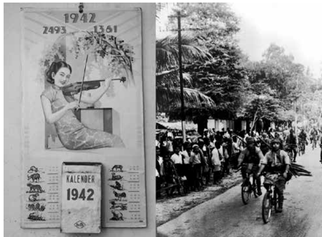
Het Japanse leger overloopt Java op de fiets

In Nederlands-Indië gaan al lange tijd geruchten over een op handen zijnde inval van de Japanners. Het massale vertrek van Japanse vrouwen en kinderen naar hun thuisland wekt bevreemding. Tegelijkertijd wordt die gedachte weggelachen. Laat ze maar komen. We zullen korte metten met ze maken, roepen de KNIL-soldaten zelfverzekerd. Maar hoe anders zal het lopen. Op 1 maart 1942 doemen de eerste transportschepen van het Japanse leger op voor de kust van Java. Na een snelle opmars vaak onder toejuiching van de Indonesiërs capituleert het Koninklijk Nederlands-Indisch Leger al op 9 maart. De Japanners beginnen meteen met iedereen te registreren. Ook de zusters van Malang. Ze krijgen allemaal een registratiekaart.