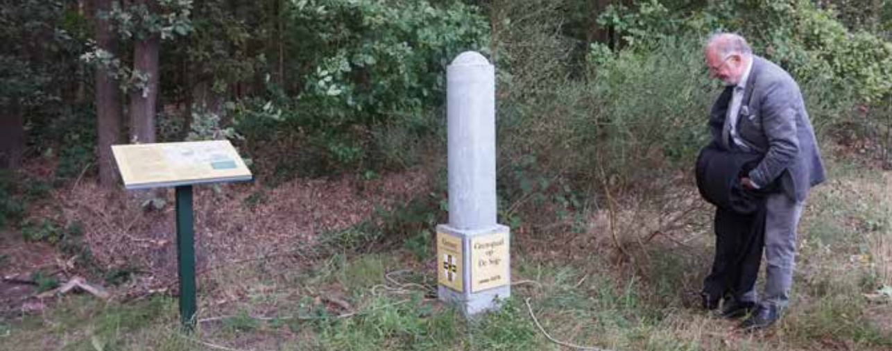
Op 11 september 2017 werd de nieuw geplaatste grenspaal onthuld tijdens de start van de werkzaamheden aan de Peelse Loop door het waterschap.