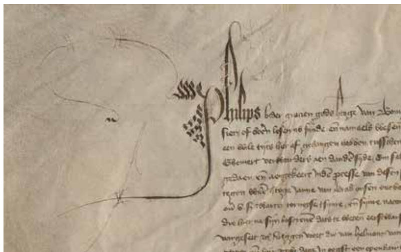
“Philips bi der gracien gods hertoge.....” etc. De aanhef van de oorkonde van 19 oktober 1434 waarin Filips de Goede uitspraak doet over de Gemertse Peel.