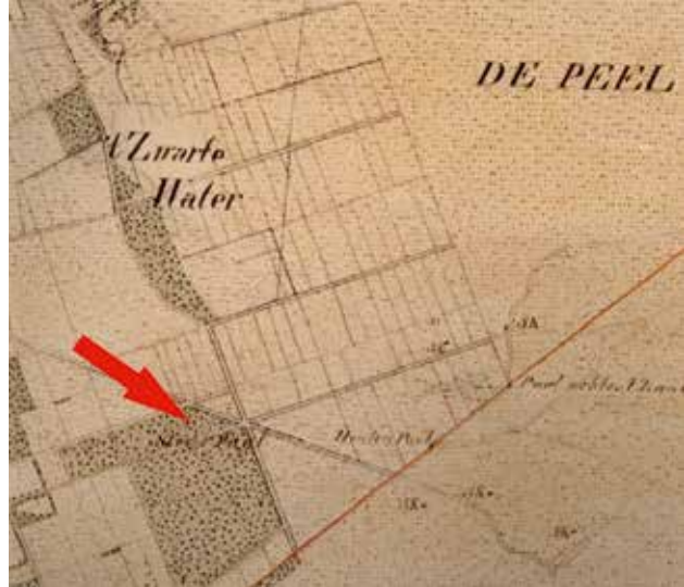
Op de chromo-topografische kaart van ca 1835 staat ten zuiden van het Zwarte Water een stenen paal getekend. Was dat de Paal op de Mommenberg?