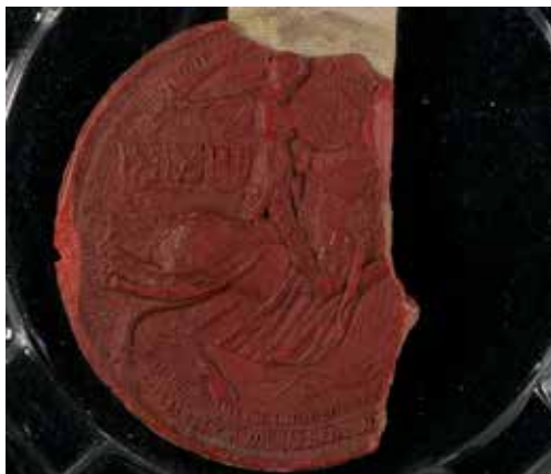
Het zegel van Filips de Goede aan de oorkonde van 19-10-1434.

worden er wegen aangelegd. Zo niet in Gemert, immers de gemeente was geen eigenaar. De gemeente moest een proces voeren tegen de rijksoverheid over die eigendommen. Pas in 1871 wordt overeenstemming bereikt. Er wordt vastgelegd dat het gebied van de Gemertse Peel ter grootte van 1694 ha binnen 15 jaar verkocht moest zijn. De opbrengst van die verkoop was deels voor de overheid en deels voor de gemeente Gemert. Voor de tweede keer een financiële strop voor de inwoners van Gemert.