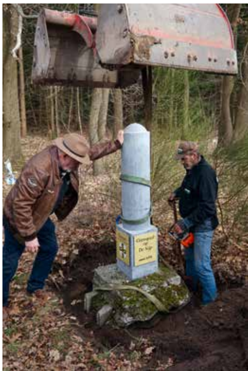
Op 4 maart 2017 werd langs De Peelse Loop een grenspaal geplaatst waar voorheen de grens lag tussen Gemert en de Gemertse Peel, maar waar geen grens hoorde te zijn.

Dirk van den Broek was namelijk niet vanaf de Stegebergse Paal verder naar het oosten de Peel ingegaan, maar juist naar het noorden. Er werd een paal geplaatst in de Wolfsbosch “bij de waterlaet, geheyten die Zijpe, daer ghene oude pael in d’eerden en stont”. De grens tussen Bakel en Gemert werd dus direct vanaf Hogen Aarle naar de Wolfsbosch gelegd en er werd een grenspaal geplaatst langs wat nu de Peelse Loop heet. In het latere verslag van de expeditie wordt opgemerkt dat daar geen oude grenspaal aanwezig was, maar alleen een oude put. Daarna gingen ze snel verder naar de volgende paal ten noorden van de kapel van Handel bij de