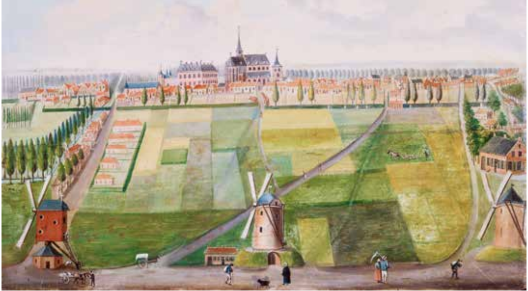
Zicht op Gemert over de Molenakker, circa 1820. Op de voorgrond vlnr de molens Het Zoutvat, De Mosterdpot en De Beer. (Schilderij Noord-Brabants Museum).

hoeve gelegen onder Bakel op ‘Scepstel’ met (in 1531:) gemaal van de slagmolen of (in 1544:) gemaal van de vlasmolen, telkens voor een periode van zes jaar en daarnaast een kleine hoeve, tegen honderdtachtig Carolusgulden per jaar. Uit deze passage zijn twee conclusies te trekken: de molen van Scheepstal is een oliemolen (zoals overigens veel water- en rosmolens) en ver na 1427 is er nog sprake van een in bedrijf zijnde molen. In latere tijden komen we nog met regelmaat verwijzingen naar de watermolen tegen, zoals in 1645 als er sprake is van “ vestigien van eenen watermolen ”, maar even later wordt bij een verpachting van de oude hoeve op Scheepstal geen molen genoemd. Bij de invoering van het kadaster in 1832 vinden we nog een perceel land terug met de aanduiding: ‘Rad van Scheepstal’ en bij werkzaamheden aan de Bakelse Aa in 1934 zijn nog enige restanten van de watermolen teruggevonden. De naam Scheepstal is waarschijnlijk ontstaan uit samenvoeging van de woorden stal (veilige plaats) en een aanduiding voor een plaats waar water