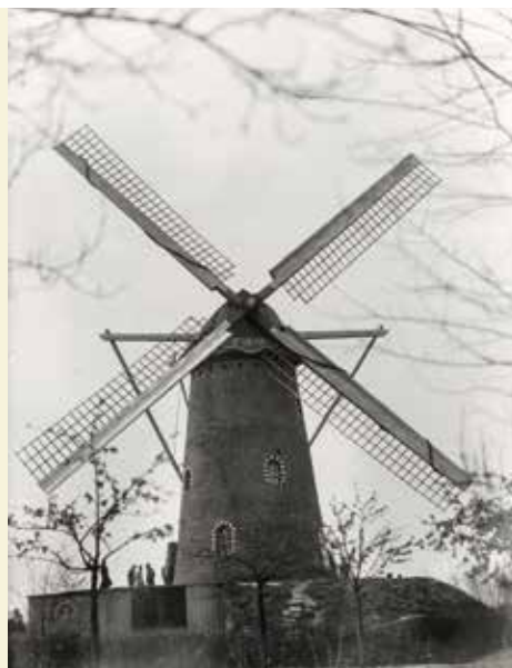
Molen Sint-Victor in De Mortel.