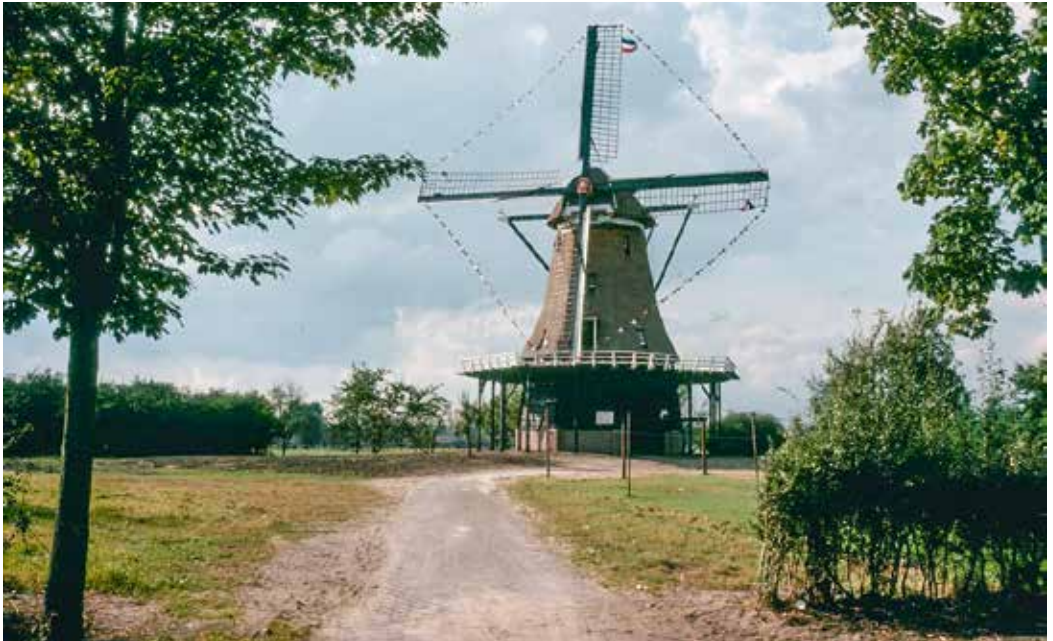
De Bijenkorf weer in volle glorie. Even later het boegbeeld van de nieuwe wijk D'n Elding.