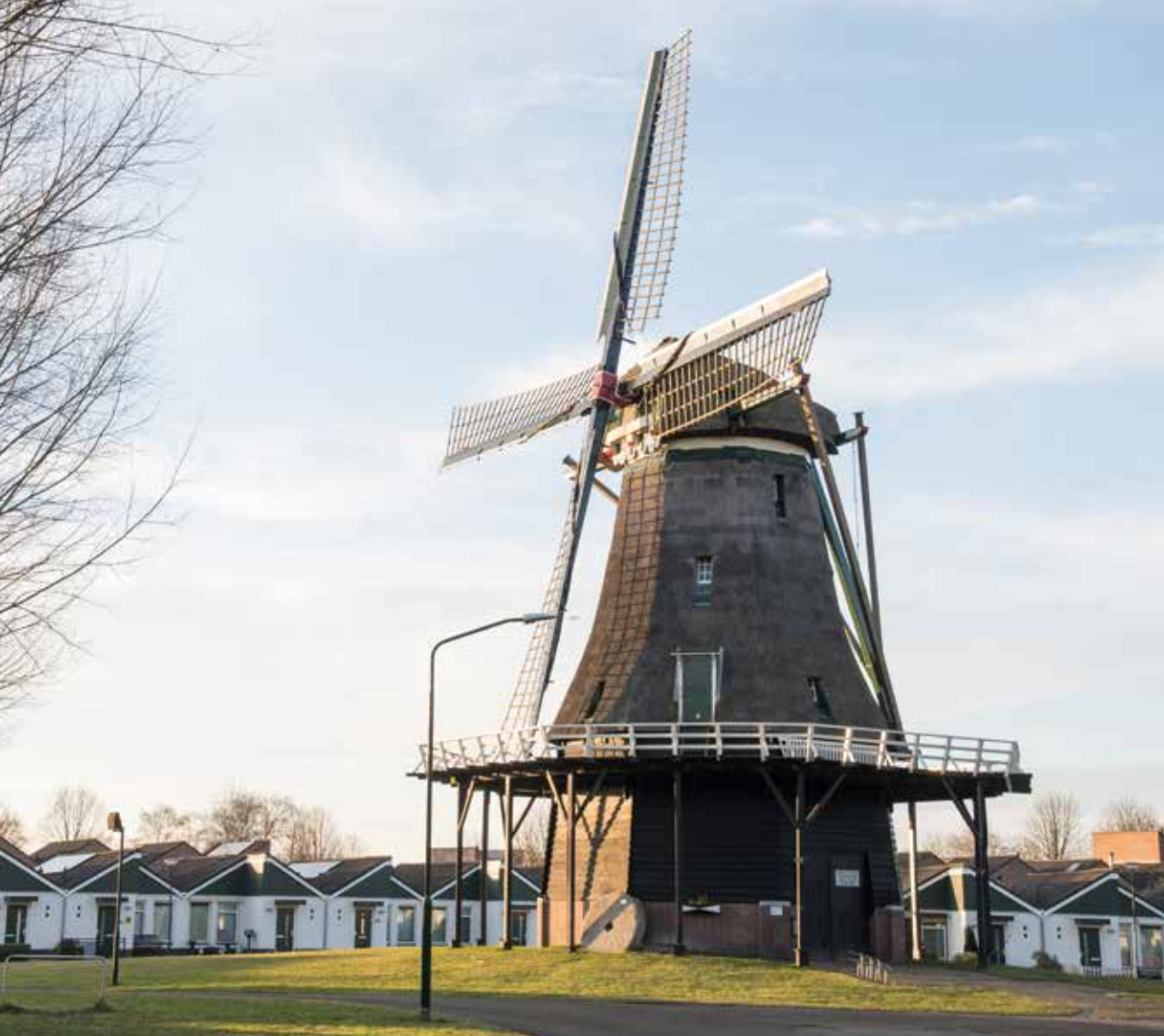
Molen De Bijenkorf in perfecte conditie. De oliemolensteen onder de stelling is gevonden bij de Gemertse 'watermolen Anno 1210'.

1944 weer van de vrije pers rolde en in november van dat jaar onze eigen Eldingse Bijenkorf afbeeldde, met op de voorgrond een zittende militair die blijkbaar spannende oorlogsverhalen aan de plaatselijke jeugd vertelt. Het meisje dat aandachtig luistert, is ruim een halve eeuw later, in 1998, nog een keer De Bijenkorf komen