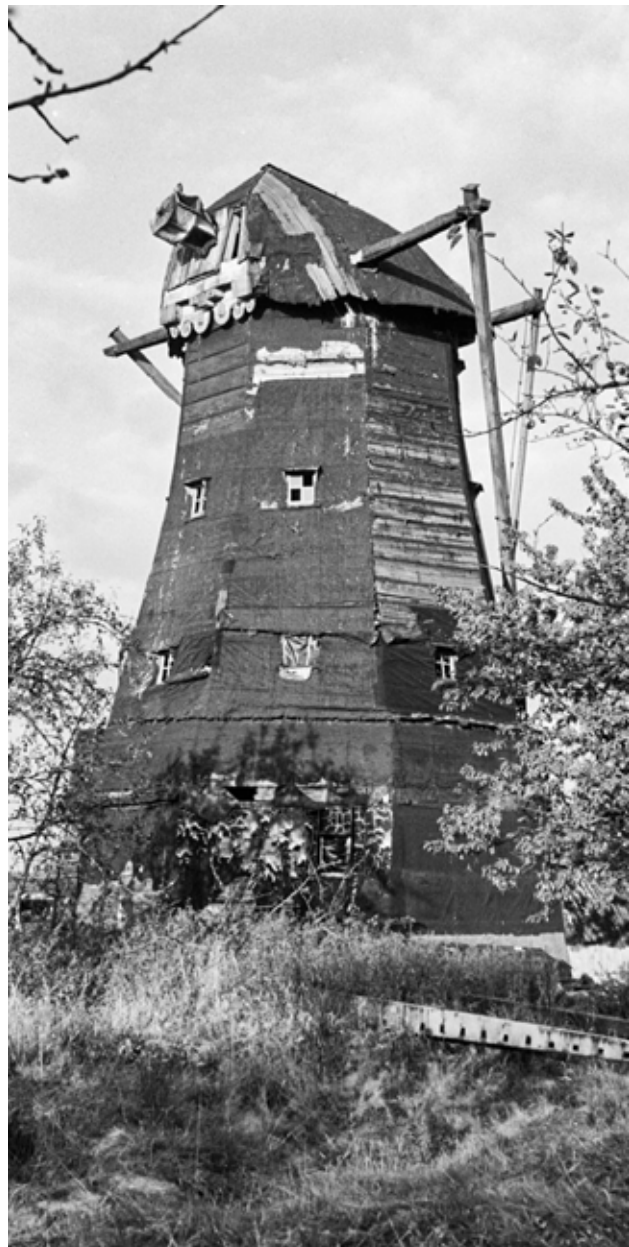
De door de gemeente gekochte molen wordt veiligheidshalve van de wieken ontdaan in afwachting van de restauratie. Op de voorgrond liggen de oude potroeden

De eerste eigenaar, in 1694, was Barend Corneliszoon Veen. Vandaar de naam De Veenboer De familie Honig, een geslacht van papierfabrikanten, nam in 1709 de molen over. In 1879 werd Pieter Dekker de nieuwe eigenaar en vanaf dat moment produceerde men in de molen geen papier, maar werd er gerst en rijst gepeld. Toen de pellerij niet meer lucratief bleek, ging Dekker