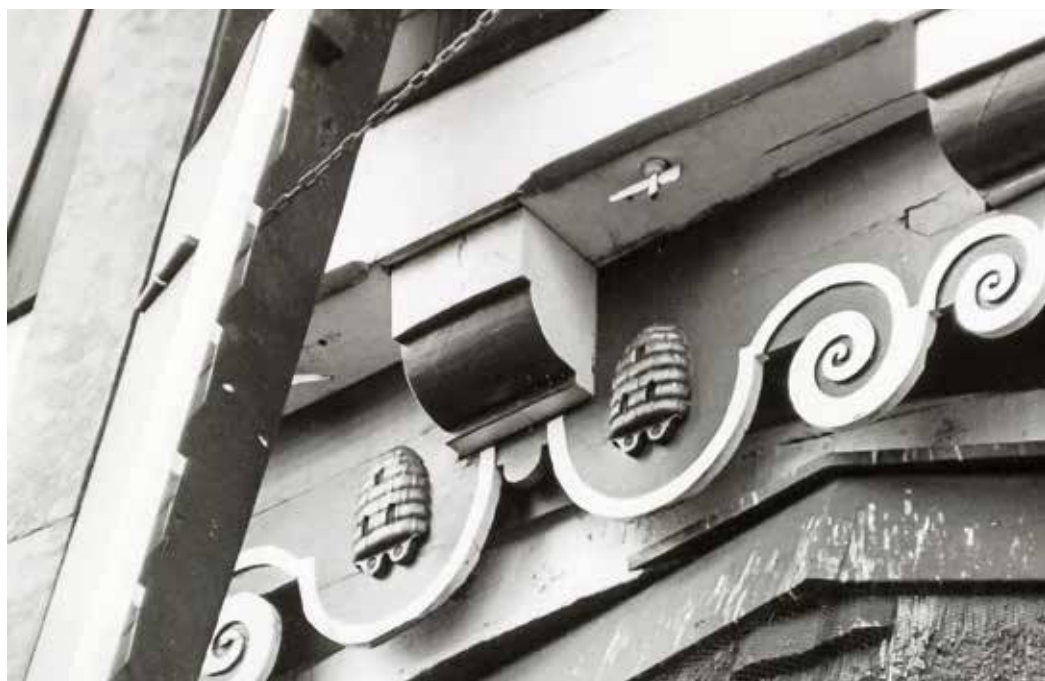
De molenbaard met de twee bijenkorfjes

Iedereen keek verlangend uit naar de beoogde restauratie, maar het duurde maar en duurde maar... Om meer draagvlak voor de restauratie te krijgen schreef Pennings een uitgebreid artikel over de molen in Gemerts Heem. Achter