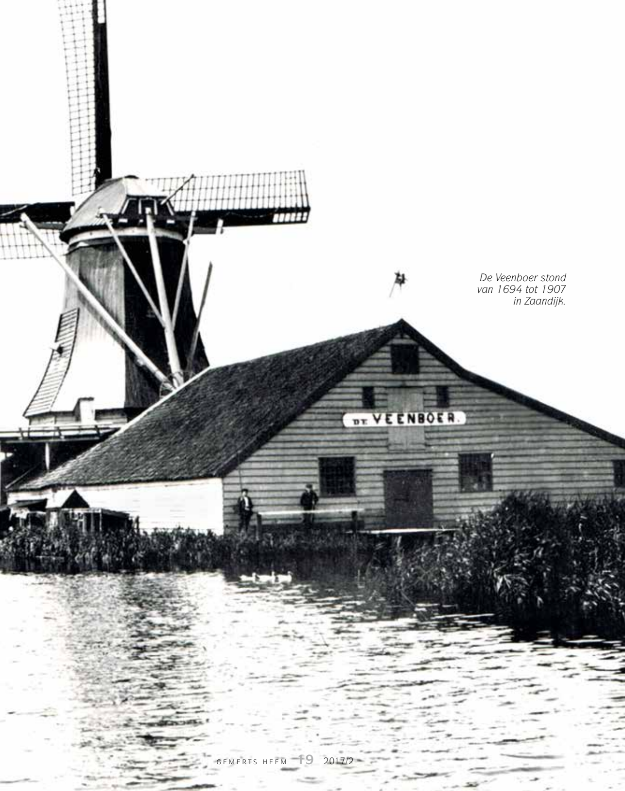
De Veenboer stond van 1694 tot 1907 in Zaandijk.