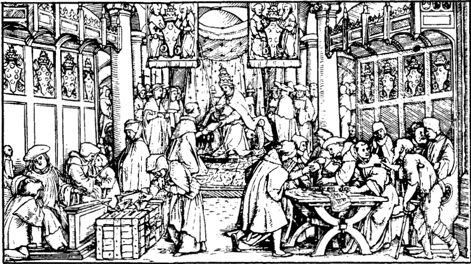
De aflaathandel. Deel van een houtsnede van Hans Holbein de Jonge uit het eerste kwart van de zestiende eeuw. Op de achtergrond zien we de paus een aflaatbrief overhandigen aan een monnik.

1000 jaar en meer! Een aflatencatalogus uit 1375 vermeldt zelfs aflaten van 18.000 jaar. 3 Kijk, dat zet aan.