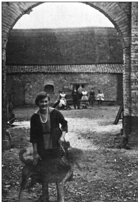
Doorkijk poort straatzijde (vóór 1927). Deze foto toont nog eens de hoogte van de boog. Door de poort zien we de andere schuur, die parallel gebouwd was aan de boerderij. Ook deze schuur werd na een gedeeltelijke instorting gesloopt. De personen zijn leden van de familie Toonen of de familie v.d. Kerkhof die als pachters de hoeve bewoonden.