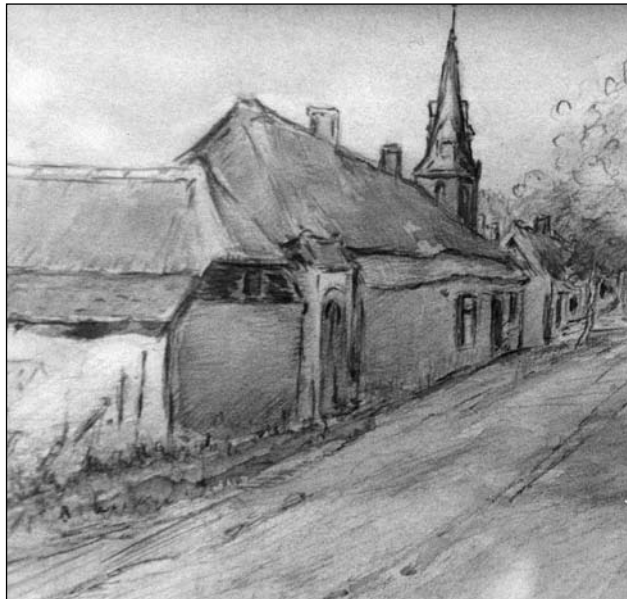
Links de schuur met de korte gevel en wolfseind naar de straat gericht. Tussen de schuur en de boerderij de poort. Na een gedeeltelijke instorting werd de schuur gesloopt, tekening ca. 1920. (Coll. Broeders Penitenten, Handel)