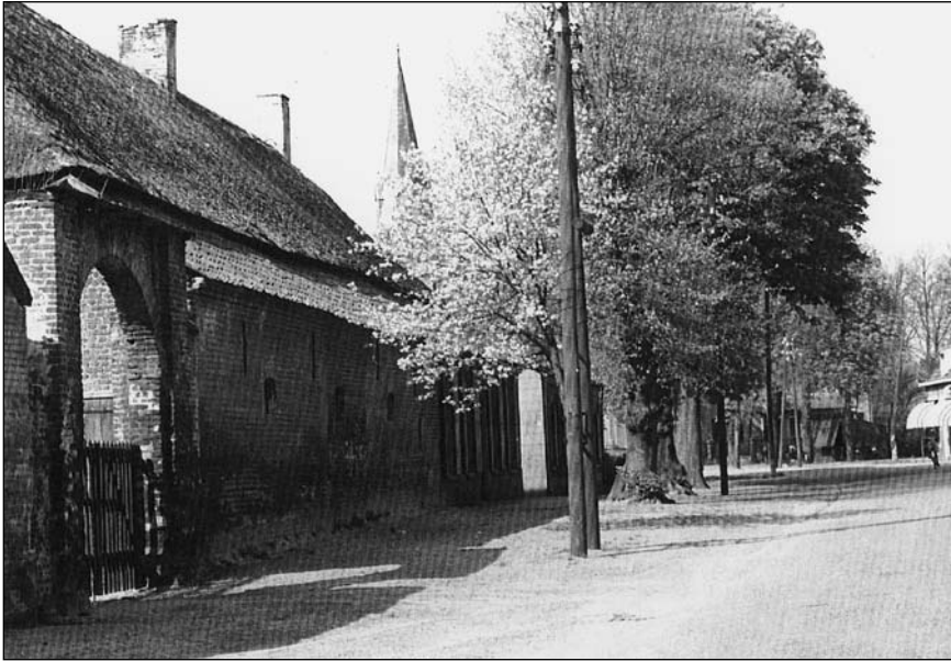
De lange gevel aan de straatzijde (circa 1950). De poort is hier nog redelijk in tact, zij het dat de kap deels verdwenen is. De poort vormt hier het sluitstuk tussen de boerderij en een schuur aan de straatzijde.