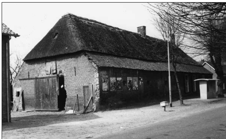
Aan deze eindgevel is duidelijk de aftakeling te zien van deze eertijds zo imposante boerderij. In de lange gevel is geen stal- of schuurdeur, deze bevindt zich in de korte gevel, met erboven het hooiluik. De hoek van de boerderij toont de sloopsporen van een poort aan deze zijde van de boerderij. Zowel in deze korte gevel als in de noordelijke- is het vlechtwerk aan de daklijsten te zien.