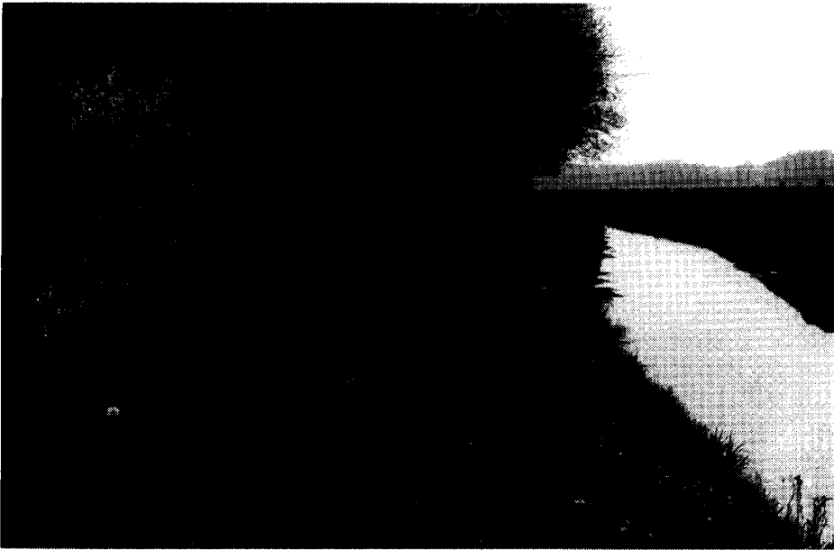
Aan de Gemertse kant de Snelle Loop volgend in oostelijke richting

rare sprongen. Hij volgt niet overal de Snelle Loop. Het lijkt er bovendien op dat ook de begrenzing van de oude hoeve niet werd aangehouden. De bezittingen van het goed Ten Hogen Aarle reikten tot over de gemeentegrens en sloten aan bij de Bakelse hoeve De Kivitsbraak. In de beschrijving van de grens in 1434 wordt aan dit grillige verloop tamelijk makkelijk voorbij gegaan. Direct na de vermelding van de grenspaal vóór De Hogen Aarle, bij de vonder, wordt geschreven: "van dien pael vort toter auden pael after die hove te Hoge Aerle aen d'ander sijde, daer die lantcommandeur van Ghemert mit een deel der Duytschen heren ende met een deel der guede luden van Ghemert quam ende seyde, dat he walgenuechde, dat men daer enen niwen pael setten, want daerbij eenen ouden staet in d'eerden.." . De paal achter de hoeve Hogen Aarle staat op een plaats waar de grens een hoek vormt. Iets verderop vertoont de grens een wat kleinere knik, maar toch is de grenspaal daar een stuk belangrijker dan de voorgaande, omdat