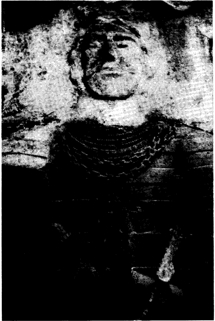
Beeltenis van een Van Berlo op een grafmonument tegen de buitenmuur van het kerkje van Berloz (foto uit 1982)