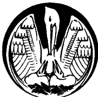
Afbeelding van een pelikaan die zijn jongen voedt met het bloed uit zijn borst.