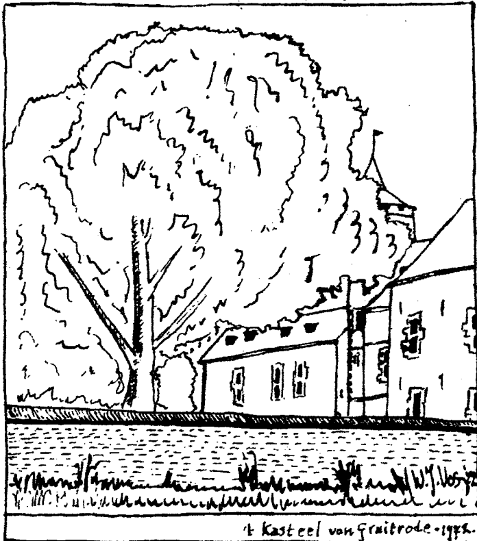
† Kasteel van Gruitrode - 1972.

Als men bij het kruispunt bij de kerk links afslaat, ziet men al spoedig het kasteel liggen. Het voorste gedeelte is het eigenlijke kasteel, daarachter ligt de kasteelboerderij, waar de ridders vroeger hun paarden stalden om daarna over een ophaalbrug door een poort het kasteel binnen te gaan. Er zijn momenteel twee eigenaren; de boer die de kasteelboerderij bezit en een chirurg uit Hasselt, die het slotje gekocht heeft van de weduwe die het tot voor kort bewoonde. De boer-