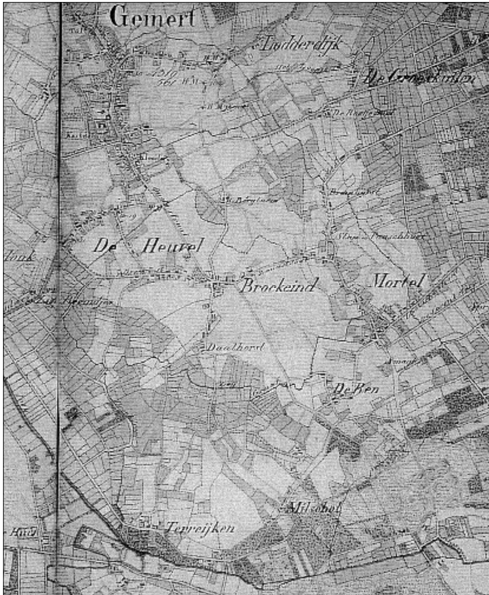
De oudste gekleurde topografische kaart van 1838. In het midden staat aangegeven Broekeind. De samenstellers van de kaart vonden dat kennelijk beter Nederlands dan Boekent, welke naam zij niet zullen hebben begrepen. De naam Daalhorst daaronder staat niet op de juiste plaats. Daalhorst ligt verder naar het westen.

op de geomorfologische kaart een aantal dekzandruggen en -plateaus aan.