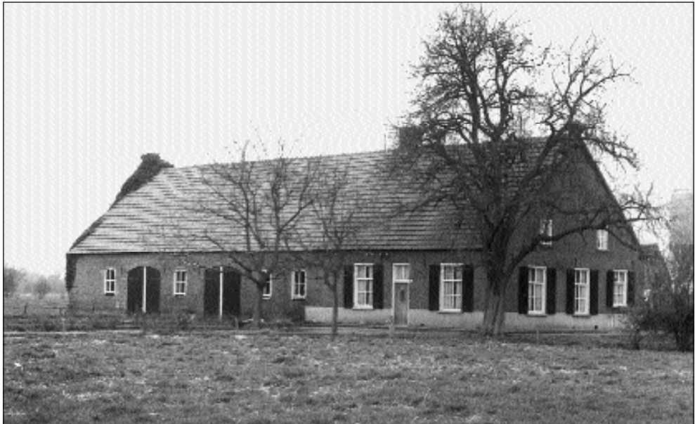
Boerderij Tereyken 29 (foto Ad Otten, 1976)

De oorspronkelijke vorm van de boerderij in Gemert is een drieschepig, langwerpige woon-stal-huis. Dat betekent dat in het hoofdgebouw zowel het woongedeelte als het stalgedeelte is ondergebracht. Vermoedelijk waren al in de middeleeuwen het woon- en het stalgedeelte van elkaar gescheiden door een tussenwand. In de korte gevels waren de ingangen aangebracht. De constructie bestond uit een aantal (veelal 5) ankerbalkgebinten, aan de bovenzijde van de stijlen met elkaar verbonden middels een dekbalk (worm). Op de dekbalken stond een sporenkap met eindschilden.