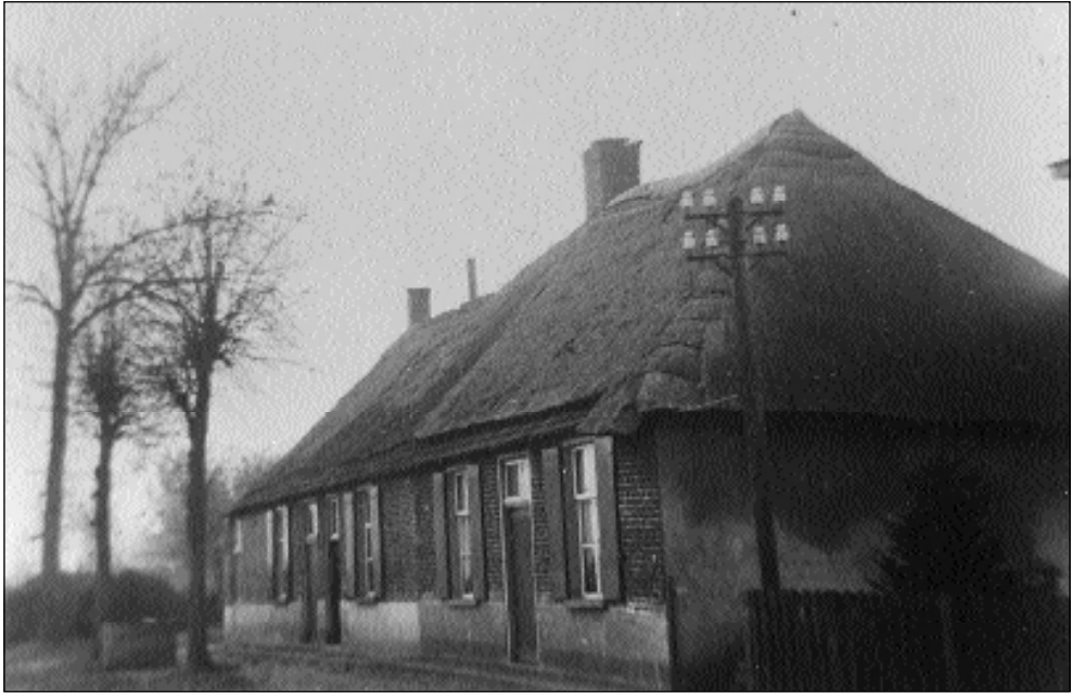
Driegezinswoning vooraan in de Broekstraat, die in mei 1963 door brand volledig werd verwoest. Dit woningrijtje stond achter de (ook verdwenen) smidse van De Fost op de hoek Oudestraat-Broekstraat, schuin tegenover de Blauwe Kei op de hoek Broekstraat-Kromstraat. De foto dateert van omstreeks 1955.

Berkes Hoeve als afsplitsing van Nieuwenhuizen en Nesen Hof als afsplitsing van Milschot. De lager gelegen delen tussen de hoeven Milschot en Nieuwenhuizen werden eveneens ontgonnen. Er ontstonden nieuwe boerderijen aan de rand van het cultuurland. Ze werden gebouwd langs de weg, die de grens vormde met de gemeint. Daardoor ontstond een typische gemeintrandnederzetting met bewoning aan één zijde van de weg. Het gehucht Tereyken is ontstaan door herhaalde bedrijfssplitsingen van het