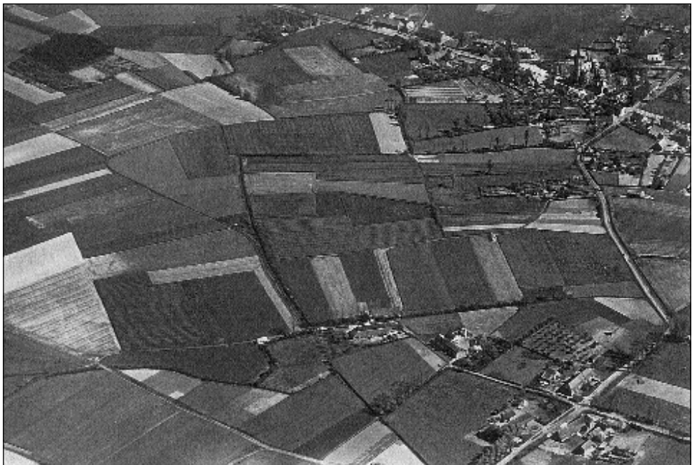
Luchtfoto van de Hoge Kranebraken (circa 1950). Rechtsboven de dorpskern De Mortel. Rechts van boven naar beneden de Renseweg.

De natte gemeint werd gebruikt voor gras- en hooiland. Juist zoals bij de droge gemeint was er sprake van gemeenschappelijk gebruik. Met name het gebruik als hooiland, dat meer perceelsgebonden is, leidde tot verdeling van de natte gemeint in percelen. De noodzaak tot een betere afwatering had als gevolg het graven van sloten, hetgeen bijdroeg aan de opsplitsing in percelen. Uiteindelijk is de natte gemeint