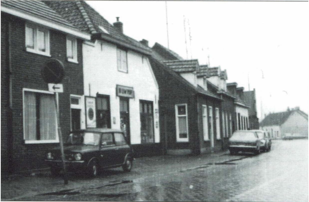
Kruiseind in de jaren '60. Het bord vermeldt vanuit deze hoek: "In uw pijp"