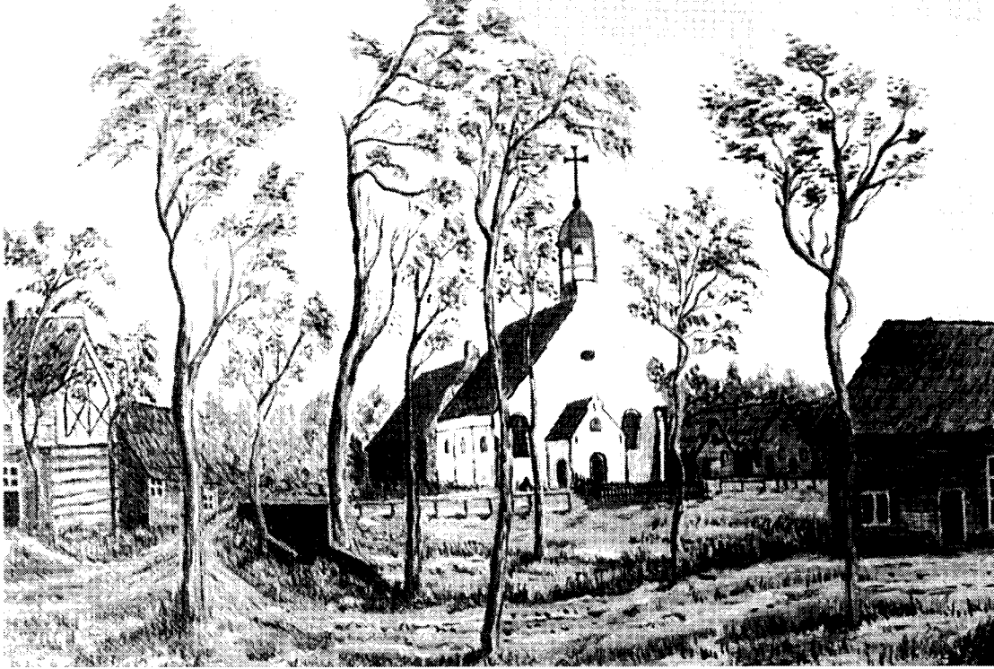
Het 17de eeuwse Predikherenklooster te Gemert aan het Binderseind. Olieverfschilderij van Peter van den Elsen naar Josua de Grave.

van neutraliteit, onafhankelijkheid en daarmee ook de katholieke religie - die ten grondslag lag aan het overnemen van de Gemertse pastorie.