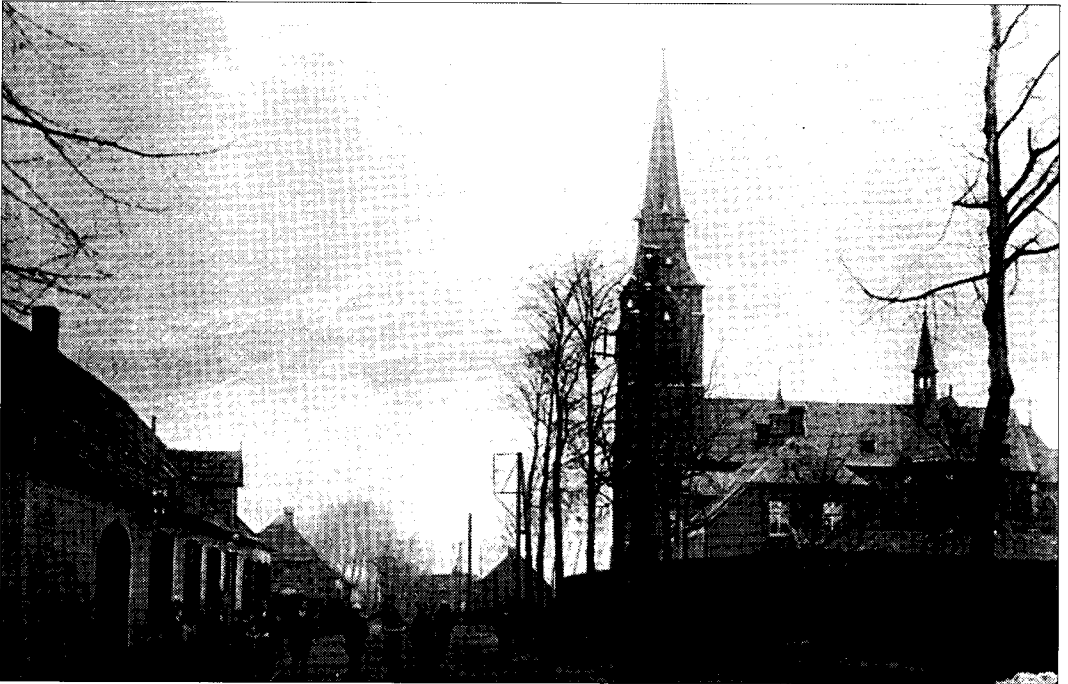
De Mortelse kerk is gefundeerd op 'zaant ojt de Vraant'

Het is dan het enige nog niet in cultuur gebrachte grondgebied in wat we nu kennen als de bebouwde kom van De Mortel. Het mat zo'n kleine 60 are, was eigendom van de gemeente Gemert en de hoedanigheid van het perceel werd omschreven als 'zandberg met heide'.