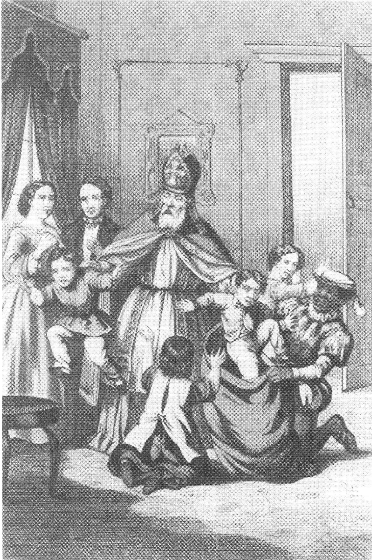
Sinterklaas bij stoute kinderen