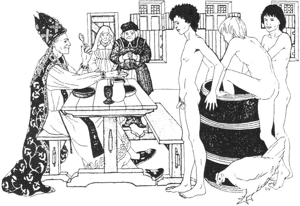
De legende van de drie jongens uit de pekelton (bron: A. Kessler-van der Klauw, De feesten van het jaar, 1994.)

werd de Nicolaas-bisschop. Het verband tussen beide feesten is voor het eerst gedocumenteerd aan het einde van de dertiende eeuw.