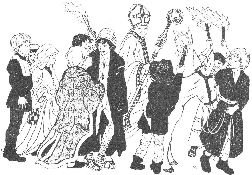
De kinderbisschop (bron: De feesten van het jaar, 1994)

superstitie (=bijgeloof), waarmee de kinderen van jongs af aan werden bedorven'. De dominees zagen in het feest een gevaar voor de openbare orde en het ware geloof. Zijn feest was "een saecke strijdend ende teghens alle goed ordre ende politye, maar ook de luiden afleidende van de ware godsdienst, ende streckende tot waengeloof, superstitie ende afgoderije".