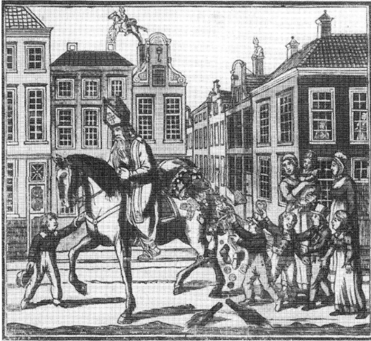
Sinterklaas te paard

kinderen gemunt hadden. De vrees was wijd verbreid dat zij inderdaad kinderen stalen.