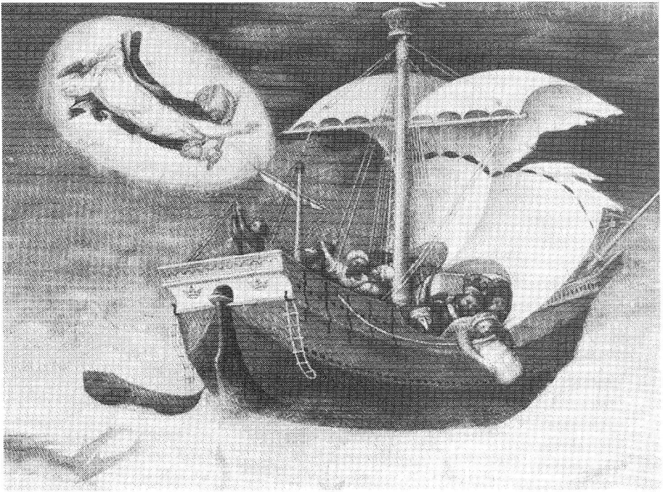
Sint Nicolaas redder van zeelui (schilderij van Gentile da Fabriano, Pinacothek Rome).

Hierin kan men het gebruik herkennen van het nachtelijke bezoek van Sinterklaas met geschenken en het gooien van snoep of pepernoten door raam of deur. Deze legende maakte Sint Nicolaas tot de patroon der verliefden, tot een soort huwelijksmakelaar. De grote speculaaspoppen, de 'vrijers' en 'vrijsters', die de jongelui elkaar gaven, spreken duidelijke taal. Aan dit gebruik herinneren de prachtige houten speculaasprenten, die we in ons land kennen vanaf de zeventiende eeuw.