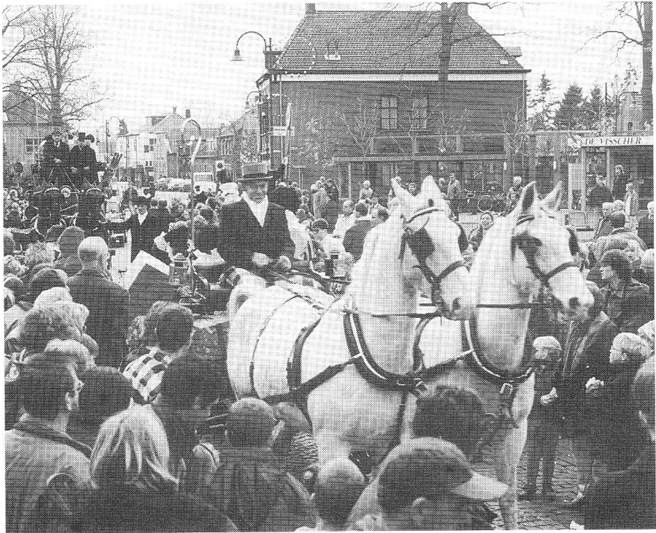
Gemert loopt uit voor de vijftigste intocht van Sinterklaas

sfeer van het kinderfeest wordt bewaard, verliest pakjesavond veel van zijn glans. Zonder dat wordt de Sint een goedgezak met een mallotig gevolg, die het snel zal afleggen tegen de populariteit van de Kerstman, die tenminste nog geurt naar het vleugje devotie en mystiek van de saus waarmee het hedendaagse Kerstfeest is overgoten. 13