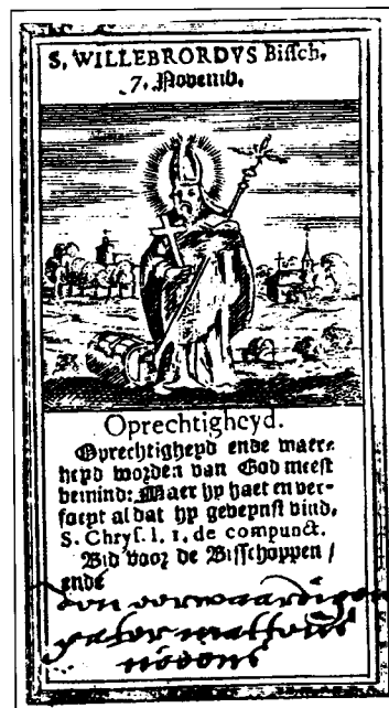
17de eeuws prentje van St. Willibrord.

De ontstaansgeschiedenis van het klooster Echternach of Epternacum is onverbrekkelijk verbonden met de mis-