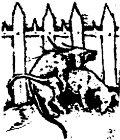
'n rekel en 'n teef (detail uit 'n 16-de eeuwse prent van Breughel)