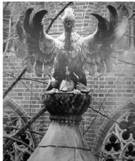
Centraal op de binnenplaats van de residentie van de Grootmeester van de Duitse Orde in Slot Malbork (Malbork) zien we een bronzen pelikaan op een nest met jongen.

Enige decennia na de ingebruikname van de nieuwe kerk blijkt 'de oude kerk' of tenminste de locatie daarvan, de compleet nieuwe bestemming te hebben gekregen van herberg en brouwhuis. Dat zal zeker gepaard zijn gegaan met de nodige verbouwingen maar desalniettemin blijft men in de Gemertse schepenprotokollen tot over een periode van nog meer dan 100 jaar vermeldingen tegenkomen van 'die herberg en brouwerije In die Olde (of: Alde) kercke'. De laatste vermeldingen die tot dusver zijn aangetroffen dateren uit 1575-1580. Op 30 december 1575 verkoopt Claes Jans die Brouwer met zijn familieleden het "huys, schuer en bachuys metten hof, malcanderen aengelegen