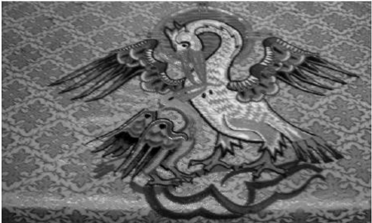
Een pelikaan die een jong voedt uit een bloedende borst (op de rug van een kazuïvel).

Dat ook het vroegere bestaan van een herberg De Pelikaan in Gemert iets van doen had met die kruisdevotie mag echter als veel minder bekend worden verondersteld. Ze hoorde tot de drukst beklante Gemertse herbergen en ze was gelegen recht tegenover de kerk op de plaats van thans De Ridderhof.