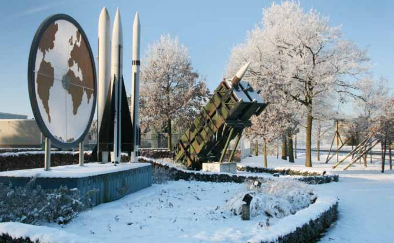
Foto boven: Ingang van de voormalige Vliegbasis De Peel met een museale aankleding van 'grondgebonden verdediging' bestaande uit onder meer patriot- en hawkkraketten (foto 2010).