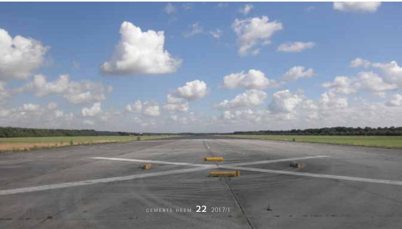
Foto onder: De deels op Gemert-Bakels grondgebied gelegen start- en landingsbaan van De Peel is nu buiten gebruik.