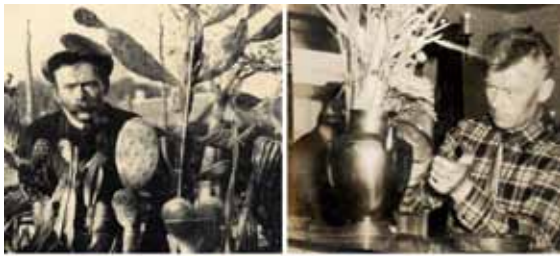
Omslag van het jubileumboek

artikel de opening van de geheel vernieuwde bloemisterij aangekondigd.