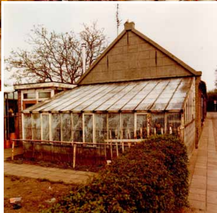
Heuvelsepad 15-17 met bloemenkas nog in de oorspronkelijke staat, ca. 1979.