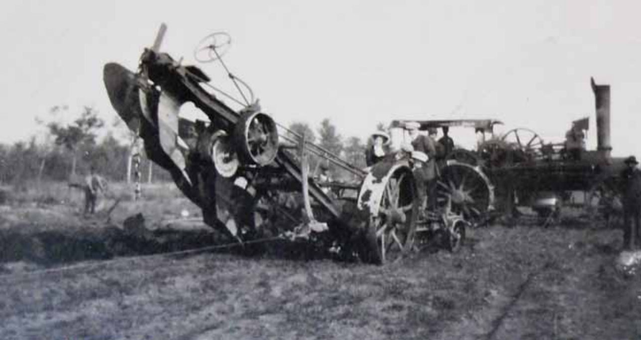
Stoomploeg aan het werk in de Gemertse Peel anno 1912.

Nederlands-Indië. In oktober 1950 neemt de gemeenteraad van Gemert een unaniem besluit tot opvang van 240 Nederlands-Indische gezinnen. Dat is exact het aantal woningzoekenden in de gemeente. De regering heeft toegezegd dat voor de opvang van elk repatriantengezin er ook een woning voor de eigen bevolking mag worden gebouwd. En dat is niet onbelangrijk in de naoorlogse periode van wederopbouw waarin de woningbouw strikt is gecontingenteerd. Den Haag vindt de naar schatting 1200 à 1500 repatrianten uit Indië op circa 9000 inwoners van de gemeente Gemert onverantwoord. Er mogen maar 120 gezinnen komen.... Maar hoe-dan-ook Gemert krijgt kleur en levert bovendien een nog steeds aansprekend voorbeeld van integratie. Elk repatriantengezin krijgt een Gemerts buurgesin. Boerenkool met sambal.