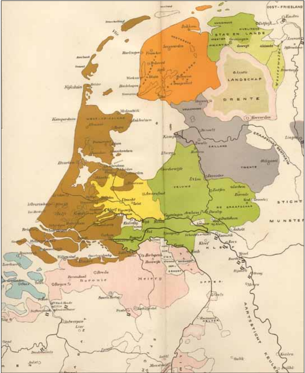
Republiek der Verenigde Nederlanden 1648-1795. De witte vlekken op de kaart in Oost-Brabant zijn de Commanjerij Gemert, Land van Ravenstein, Graafschap Megen en de Baronie van Boxmeer.