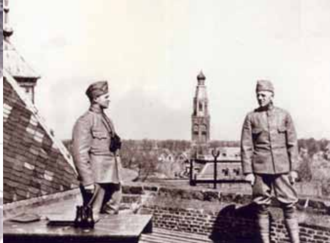
Landstormers in de luchtafweer en luchtwachtdienst

3) ?Kinderen mogen niet bij de wedstrijd aanwezig zijn.