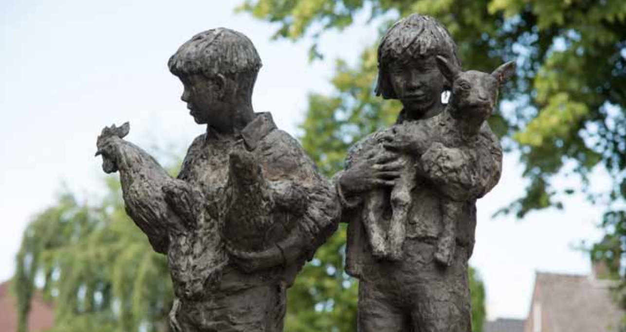
En altijd goed uitkijken bij het oversteken

kreeg mede door René de naam van een kunstenaarsdorp.