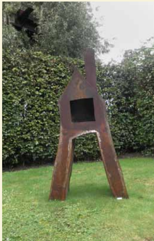
Kacheltje op poten.