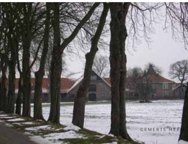
Hoeve De Dompt ook bekend als de Annahoeve, januari 2010.

In 1914, 'n paar maanden na het uitbreken van de Eerste Wereldoorlog, biedt het Gemerts parochiebestuur het patronaatsgebouw voor de huisvesting van het uit Leuven door de Duitsers weggebombardeerde grootseminarie van de Congregatie van de H.Geest, pioniers van de missionering in Afrika. Zo'n 700 van hen 'rusten' nu op het kerkhof in het kasteelpark. De Eerste en de Tweede Wereldoorlog sla ik verder over. Dat is een verhaal apart. Ik neem de draad pas weer op bij de vluchtelingen uit