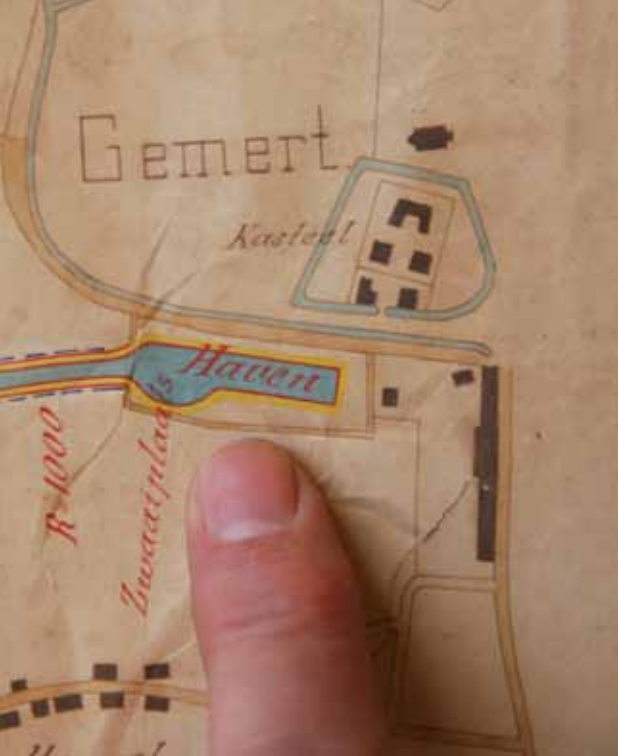
De op Schoorswinkel tegenover de kasteelpoort geplande haven op een plankaart uit 1839