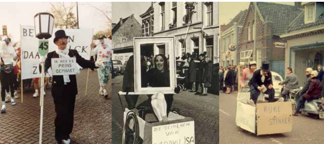
Toon als prinsverwekker, als Mona Lisa en als rijke stinker.

grote schoonmaakbeurt, maar Toon nam overal een pilsje en de kinderen kregen limonades of een chocolade. Een extra dag Carnaval dus.