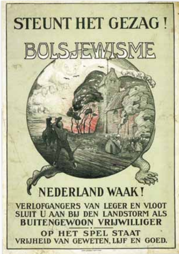
Een anti-bolsjewisme affiche.

St. Lidwina; De Fransche jongens van het kasteel."