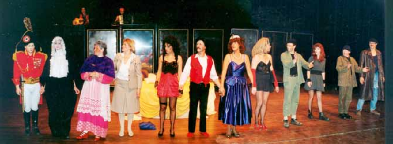
Spelersgroep Le Balcon, 1994