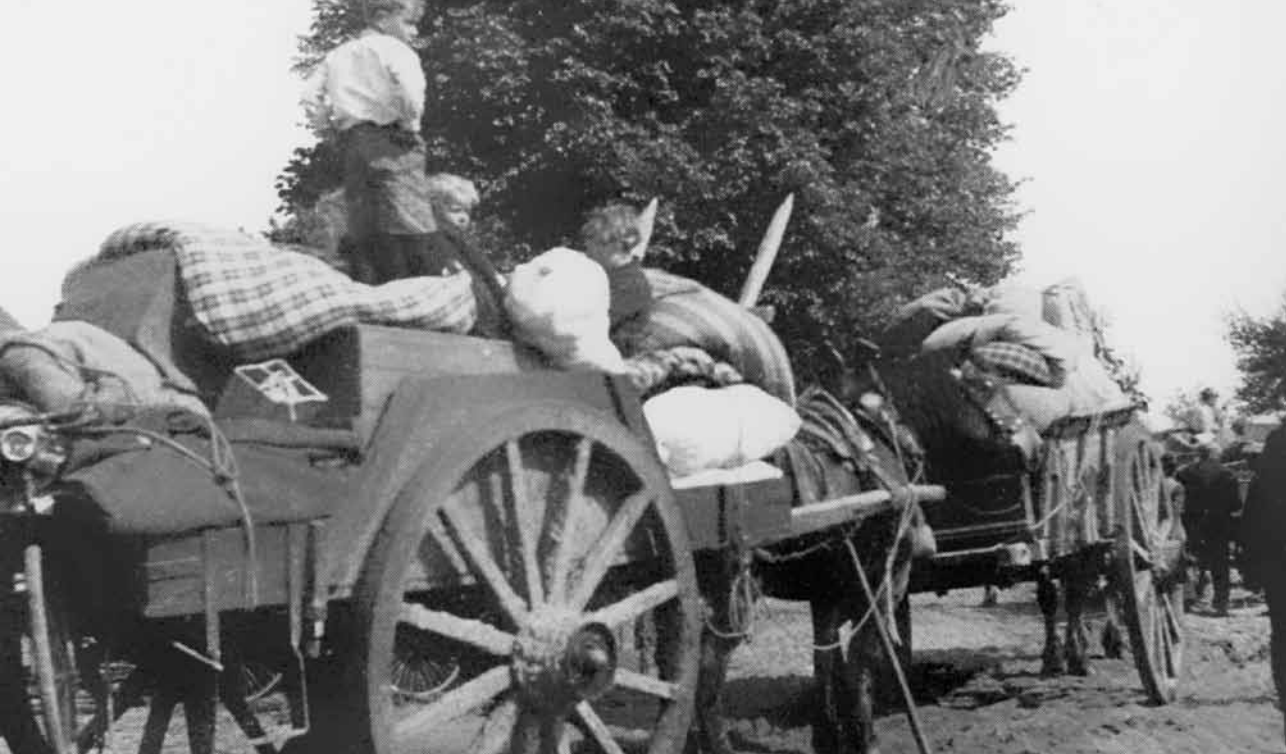
Met de hoogkar werd zoveel mogelijk bezit meegenomen

ber. Daarin werd de verdedigende taak van de Peel-Raamstelling veranderd in een vertragende. Daardoor zou een mogelijke strijd waarschijnlijk maar van korte duur zijn. De betrokken bevolking hoefde daardoor niet meer te evacueren maar mocht "uitwijken" naar naburige dorpen. Op basis hiervan ontwierp de commandant IIIe Legerkorps een nieuwe regeling en legde dit het Algemene Hoofdkwartier voor. Het antwoord is lang uitgebleven. Eerst op 8 april stemde het opperbevel in met het nieuwe plan. Op 10 april 1940 ontvingen de oost-Brabantse burgemeesters van de commandant van het IIIe Legerkorps een hernieuwde "Regeling Afvoer Burgerbevolking". Daarin werd afgezien van een evacuatie naar Zeeuws-Vlaanderen. De nieuw aangegeven vluchtoorden lagen nu veel dichterbij, veelal in de eigen of in een buurgemeente. Daarbij ging