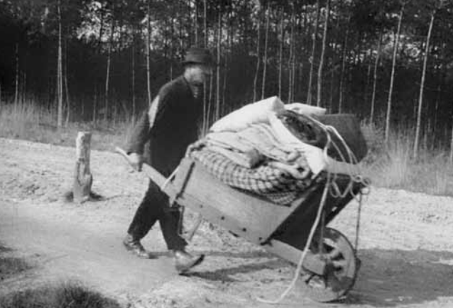
Sommigen hadden geen kar maar wel een kruiwagen