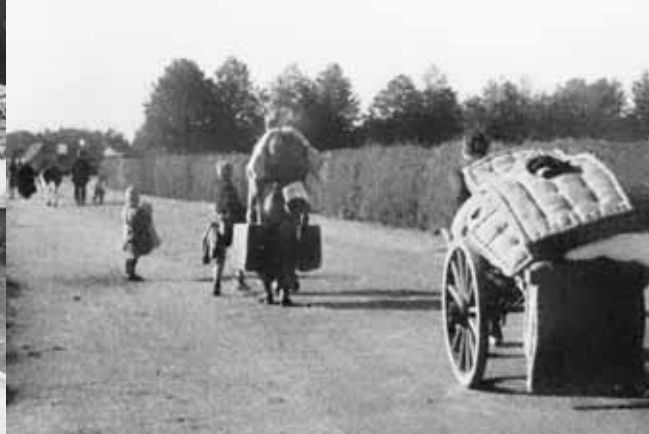
Evacuatie met paard en wagen en evacuatie te voet

werden bij strategische objecten en plaatsen geplaatst. In navolging van de maatregelen, ten behoeve van de burgerbevolking, genomen tijdens de Eerste Wereldoorlog werden ook nu richtlijnen uitgevaardigd ter bescherming van de bevolking in geval van oorlog. Op 26 maart 1935 gaf de Nederlandse regering het "Voorschrift betreffende de ingeval van oorlog, bij een inval des vijands, voor de afvoer van de uitwijkende, verdreven of in onveilig gebied wonende burgerbevolking te nemen maatregelen" uit. Dit zeer geheime voorschrift was vastgesteld bij beschikking van de Minister van Defensie met instemming van de Minister van Binnenlandse Zaken. Het werd kortweg als "Voorschrift afvoer burgerbevolking" aangeduid en eind augustus 1939, bij het ingaan van de algemene mobilisatie, aan de burgemeesters toegezonden. Op 3 september volgden twee, eveneens geheime, verbeteringen. Eerst eind november 1939 volgde een verzegeld pakket dat de "aanwijzingen voor de burgerbevolking" bevatte. Deze moesten door de zorg van de burgemeester worden gepubliceerd en aangeplakt zodra Nederland bij een oorlog werd betrokken. Op basis van het voorschrift afvoer burgerbe-