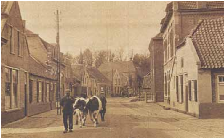
Streetgezicht Binderseind, april 1928.