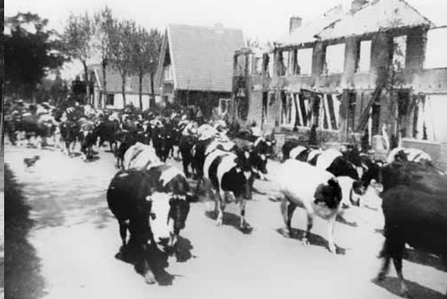
Terugkeer van het vee, zoals hier in Nijkerk.

vee te verzorgen en te melken. Het merendeel keerde echter op Eerste Pinksterdag, 12 mei, terug naar De Rips. De geëvacueerden uit Milheeze keerden meest op de Tweede Pinksterdag of daags daarna terug.