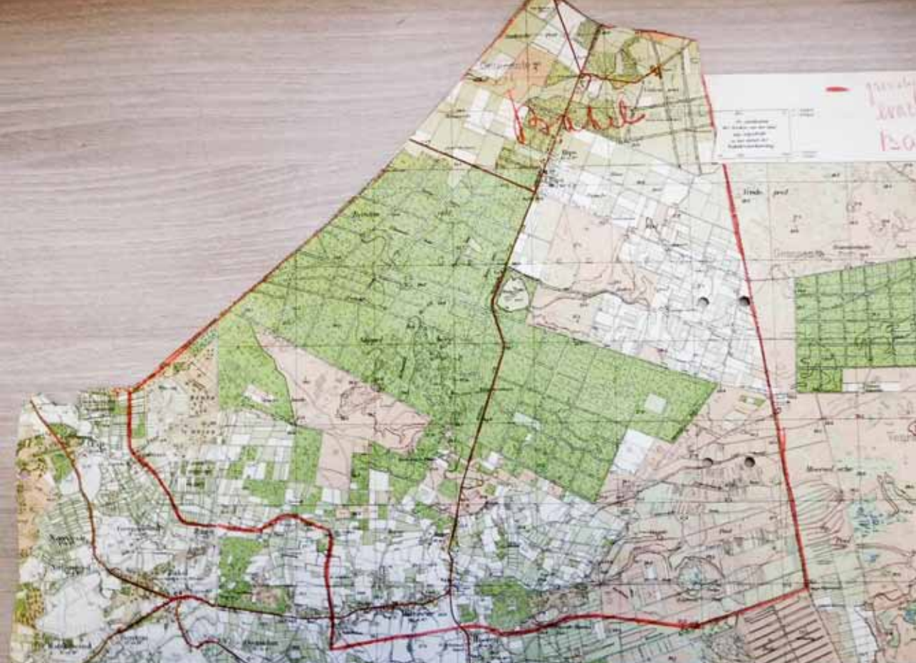
Topografische kaart verstrekt door het Militair Gezag met het deel van Bakel en Milheeze dat in geval van oorlog moest worden geëvacueerd

naar Hansweert gaan en om vervolgens met het veer over de Westerschelde naar Walsoorden in Zeeuws-Vlaanderen worden gebracht. Van daaruit konden de voorlopig vluchtoorden worden bereikt. Voor Gemert was dit de gemeente Hontenisse en voor de inwoners van Bakel en Milheeze waren dit Hontenisse en de toenmalige gemeente Graauw en Langendam. De huisvesting voor de evacués werd voorbereid door het CAB in de provincie Zeeland. De reizigers zouden per wijk in groepen worden ingedeeld en onder leiding van een hoofd- en een hulpgeleider naar