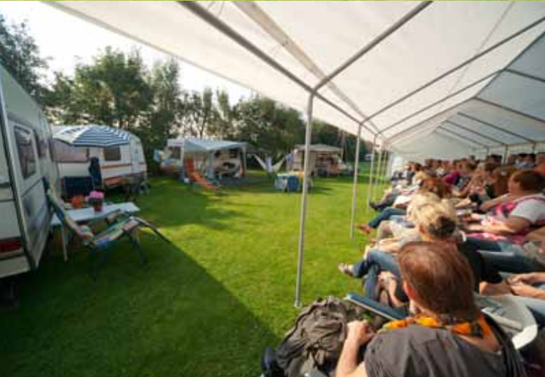
Bij de Familie Avenir op de Camping, 2011