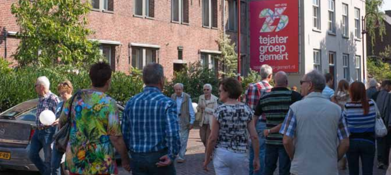
Visitekaartje van de 25-jarige Tejatergroep aan de gevel van het rectoraat Nazareth, september 2013