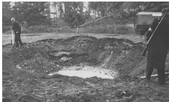
OD-er met geweer houdt toezicht bij de krater.

Bedoelde gaten zijn het resultaat van een tweetal Duitse bommen die om 04.50 in de ochtend van 5 oktober 1944 op het Borretplein ontploften. 1 Heel het kasteel trilde en veel ruiten vlogen aan stukken. Grote paniek onder de paters en fraters en snel schoot eenieder enkele kledingstukken aan. Zouden nog meer bommen volgen? De fraters van het kasteel vroegen zich in hun dagboek af of de bommen voor hun huis waren bedoeld. Pater Loffeld meldde dat hij eerst een vliegtuig enkele malen laag over had horen cirkelen en daarop vallende voorwerpen waarnam. Direct daarop volgden de explosies en vlogen ook de vensters van zijn kamer aan