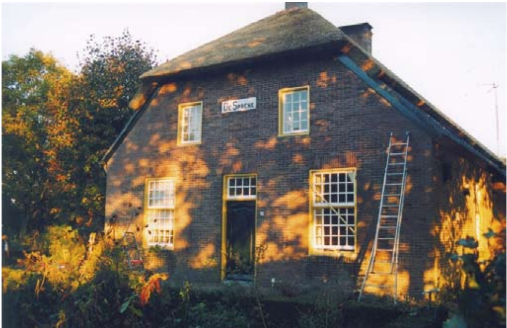
Hoeve De Sprenk (Lijsterlaan 28) ligt midden in het brongebied van het riviertje De Rips.

We gaan er van uit dat Torrentinus goed thuis was in de Latijnse taal. In Latijnse woordenboeken komen we als betekenis van ‘torrens’ niet alleen “stromend water” tegen. Er is nog een andere betekenis. Het bijvoeglijk naamwoord ‘torrens’ is