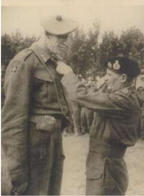
Veldmaarschalk Montgomery onderscheidt generaal Barber, commandant 15th Scottish Infantry Division, die met zijn staf 'lag' in het poortgebouw van het kasteel. 'Monty' werd nooit graag met hem gezien, maar in Gemert was Barber een bezienswaardigheid.

generaals. Dat het kasteel in Gemert moest worden aangevallen werd niet vermeld, evenmin het centrum van Oss, waar deze nacht ook enkele bommen vielen. Voor een Ju 87 spreekt ook het bomkaliber. Een lading van een 250 kg bom onder de romp en 50 kg bommen onder de vleugels was voor dit toestel niet ongewoon. 2