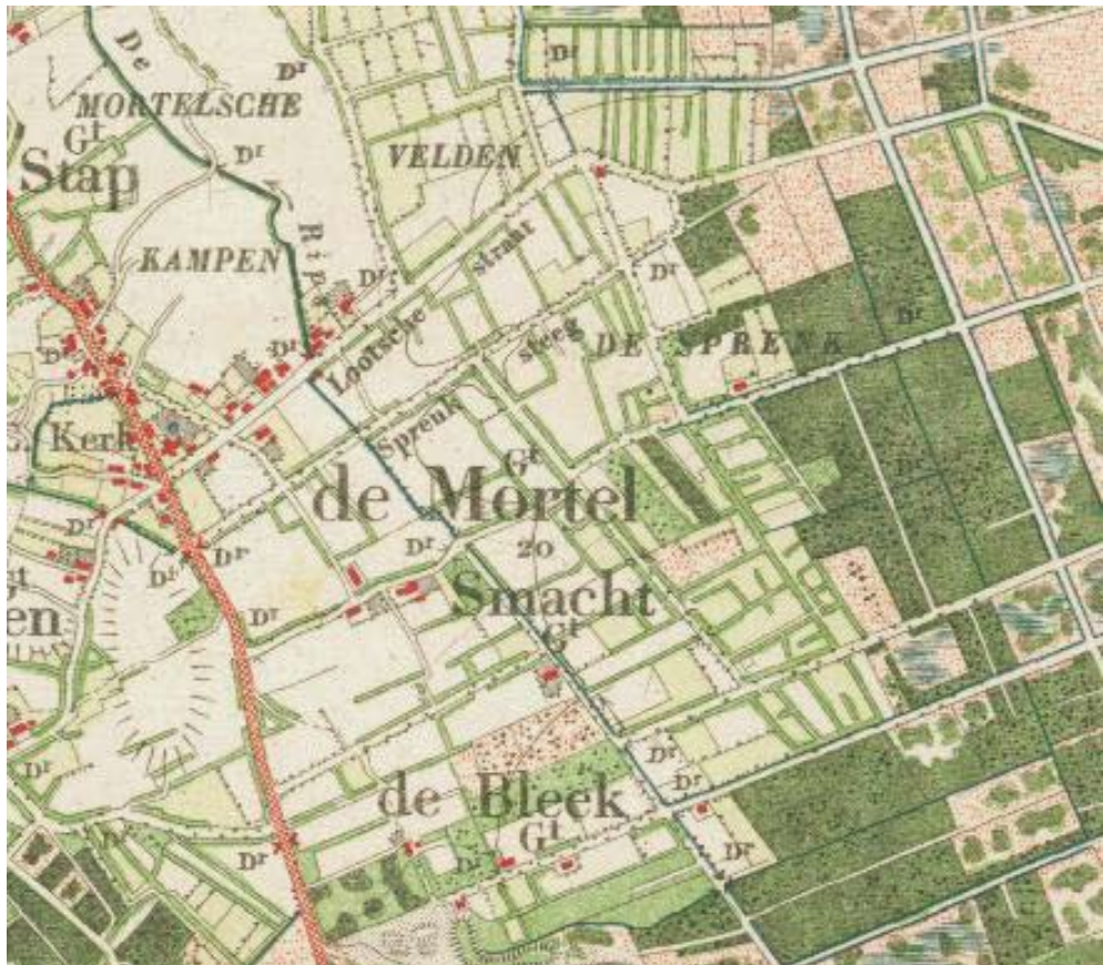
Topografische kaart is van ca 1900.

bevriest. Op die manier werd schade door vorst aan de graszode voorkomen en tegelijkertijd werd hierdoor bereikt dat het gras zich in het voorjaar sneller herstelde en eerder ging groeien. De winst kon oplopen tot een extra snee gras in het voorjaar. Vloeiweiden zijn in Noord-Brabant al lang niet meer in gebruik. In de 19 de eeuw was er nog een