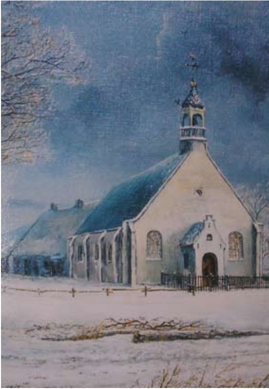
Predikherenkapel anno 1675, naar Valentijn Klotz (door Piet Kuppens)

met de Rozenkrans mee naar Gemert dat al meteen vele pelgrims trok. In 1643 bestond het klooster behalve een kapel al uit drie huizingen en een brouwerij met hof en boomgaard. Nog hetzelfde jaar kreeg het nieuwe klooster het recht om ook zelf novicen aan te nemen en niets leek een nieuwe bloeiperiode van dit van oorsprong Bossche klooster nog in de weg te staan. Na de Vrede van Munster werd Gemert echter bezet door