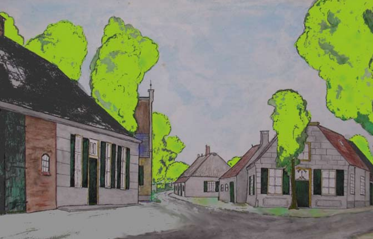
Reconstructie hoek Broekstraat-Oudestraat-Boekent in 1945 (tekening Ad Otten, 1970). Vlnr: De Roskam, (nog net zichtbaar) De Blauwe Kei, de weversrij, de Spilkörf.