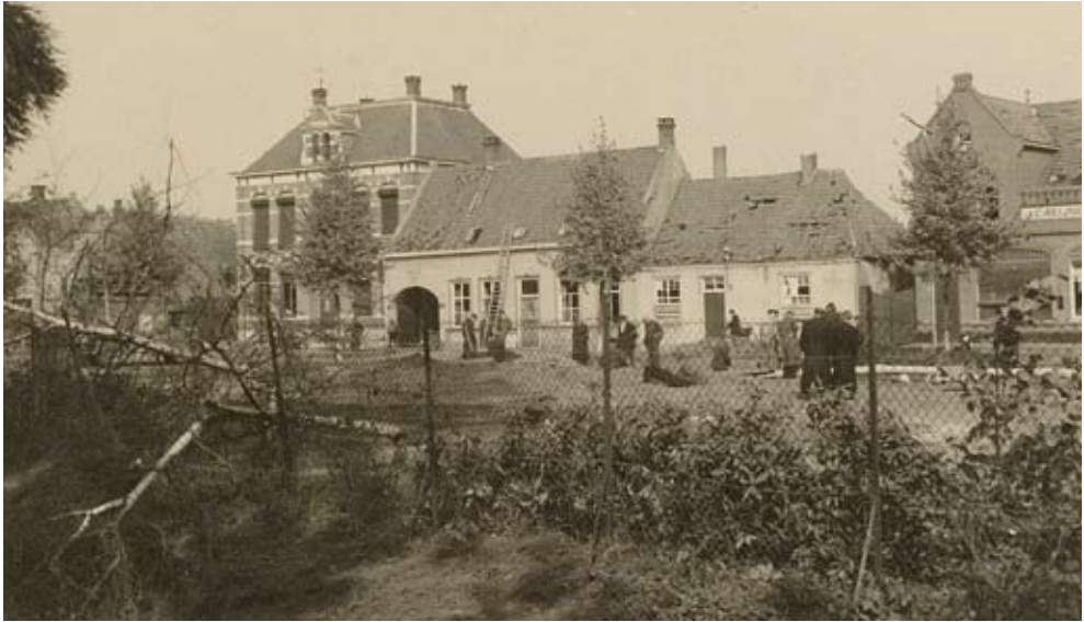
Schade aan gebouwen en ook ontwortelde bomen in het kasteelpark.