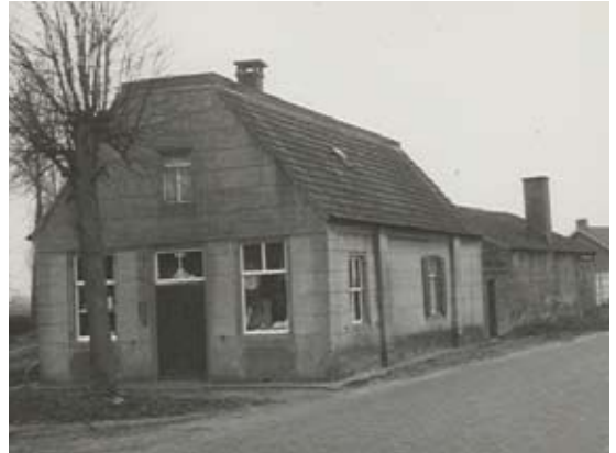
Huis van 'sméd' De Fost. Op de korse kant het winkeltje, nov. 1961.