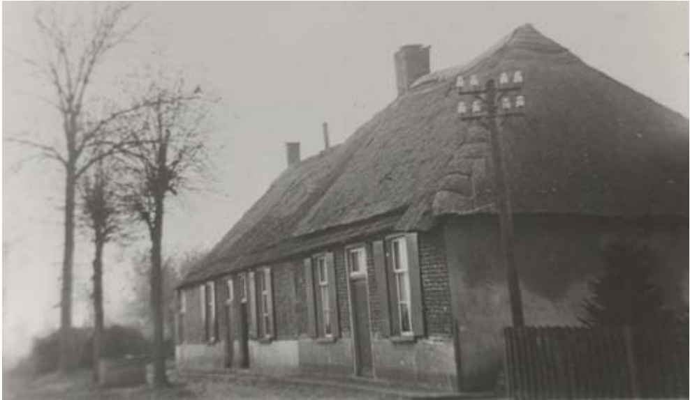
Drie weverswoningen. Duidelijk is dat het voorste deel later is aangebouwd.