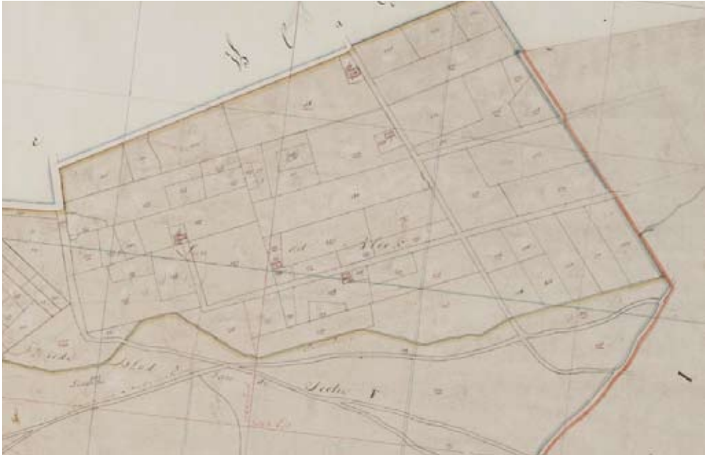
Kadasterkaart van De Bleek (1832). Links op de kaart is te zien dat de huidige doorgaande weg van De Mortel richting Bakel nog niet in zuidelijke richting was doorgetrokken. Rechts de huidige weg De Bleek. Aan de zuidkant vormt een natuurlijke beek (noordelijke tak van Snelle Loop) de grens van het ontgonnen gebied. Het gebied De Bleek ligt pal ten noorden van deze waterloop. Ten zuiden daarvan staat de Beekse Peeldijk aangegeven. De oude route voor de mensen uit Beek en Donk naar hun gebied in de Peel. De Beekse Peeldijk lag ongeveer op de plaats van de huidige Nachtegaallaan.

de ondergrondse waterstroom en wordt het water naar het oppervlak gedwongen. Door dit zogenaamde wijst-verschijnsel ontstaat een moerassig gebied waar veel kleine beken hun oorsprong hebben. Dit verschijnsel komt in Noord-Brabant voor in een smalle strook pal langs de Peelrandbreuk en sommige begeleidende geologische storingen. In het noordelijk deel van het gebied van de Peelrandbreuk (van Oss tot in Gemert) wordt hiervoor de term “wjist” gebruikt. In Heesch komt de naam voor bij de gehuchten Hoge en