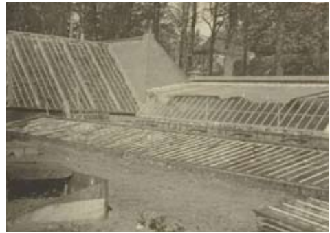
Groentekassen van de Congregatie van de Heilige Geest, omtrent 1935.