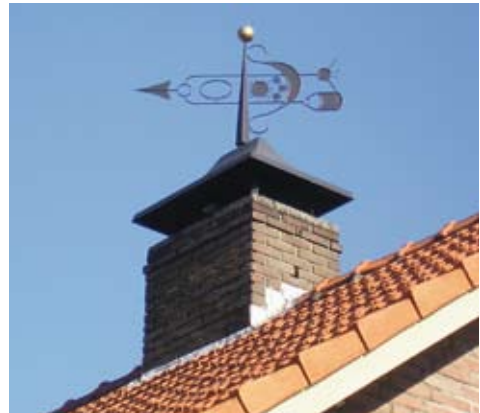
De Spoetnik en het Mir-ruimtestation in de windvaan van Huize MIR.

genoten. Bij hun terugkeer dachten zij aanvankelijk dat de afzetlinten en oranje dekzeilen een versiering waren