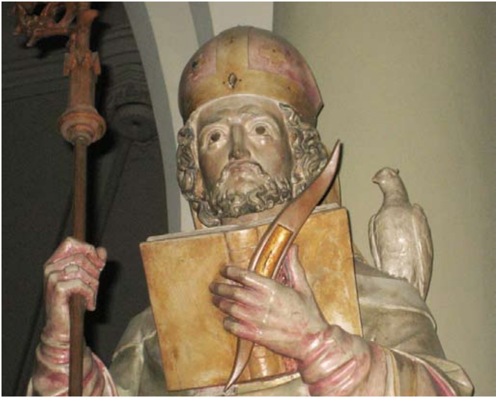
Sint Severus, patroon van de wevers, in de Gemertse kerk.