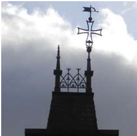
Het gesmede kruis op de Latijnse School herinnert aan het Duitse Ordekrus op de topgevel van het vroegere schoolgebouw.