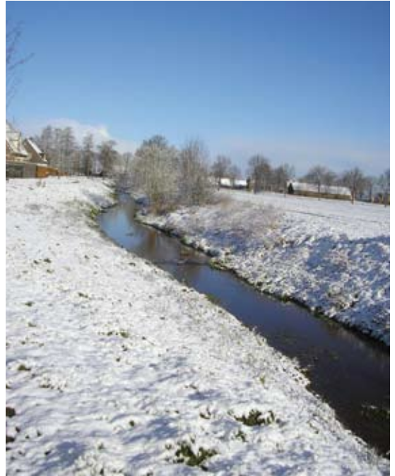
De Rips ten oosten van De Mortel, winter 2008.

Blekkeling dus als een slecht soort turf en een blekkeling-veld is de plaats waar die turf werd gewonnen. Een blekkeling-veld gaat samen met moervelden en uitgestoken turfputten. De uitgang –ling van het woord blekkeling is vrij algemeen, zodat we mogen concluderen dat het eerste deel ‘blekke’ de kern van de betekenis is. ‘Blekkete’ duidt daarmee op een soort turf. Hiervoor is al aangehaald dat de betekenis van woorden zoals bleek, blek en blik in veldnamen sterk samenhangen. Feitelijk hebben we met hetzelfde woord te maken dat afhankelijk van het gebruikte dialect soms wat langer en soms wat korter werd uitgesproken. Onze naam ‘bleek’ en het eerste deel van ‘blekkeling’ mogen we daarom als gelijkwaardig beschouwen. Daarmee komen we tot de conclusie, mede dankzij Torrentinus, dat de laatmiddeleeuwse betekenis van ‘bleek’ te maken heeft met turf als brandstof en dat de veldnaam aangeeft dat op die plaats voorheen turf gewonnen werd. In de 19 de eeuw en ook nu nog kwam de naam ‘bleek’ vaak voor als (voormalig) ven. We mogen ervan uit-