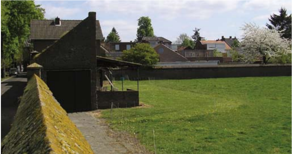
Een blik over de muur in de Heilige Geestlaan...

een groentekas en daarvoor lagen ook nog een paar rijen, met glas afgedekte, groentebakken. Tot de vestiging van de Jezuïeten op het kasteel in de jaren 1880-1881 was er nog een directe verbinding van het Hopveld naar het poortgebouw van het kasteel. De Jezuïeten, en