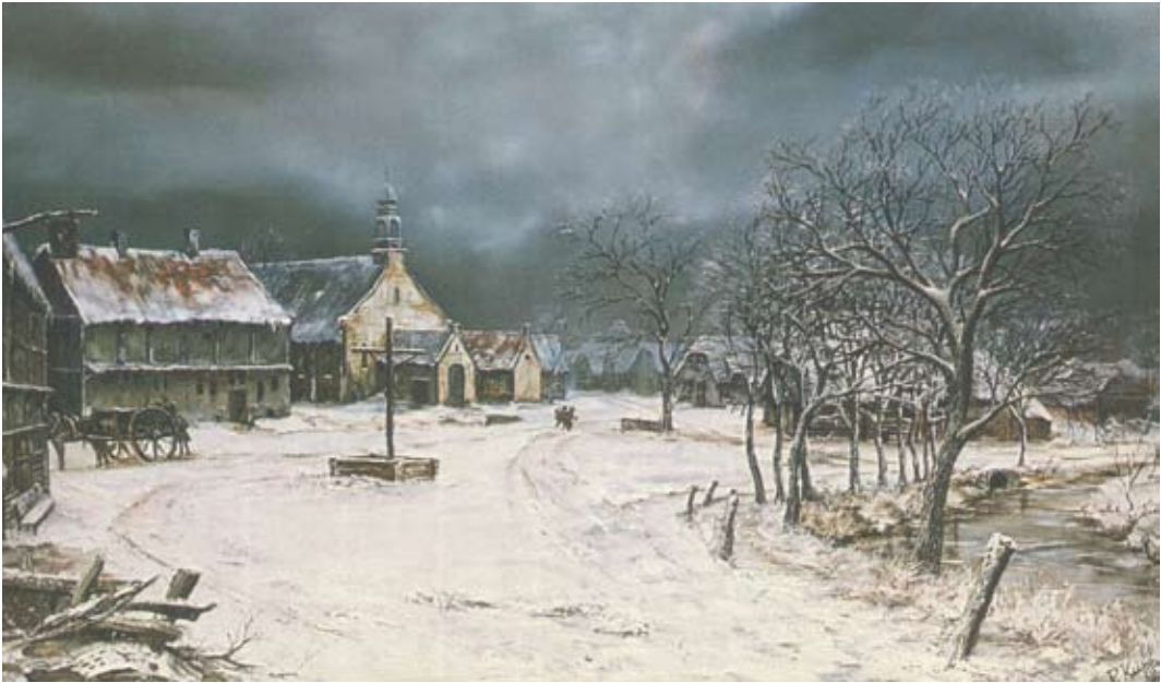
Schilderij Piet Kuppens van het Gemerts Marktveld, naar Valentijn Klotz (1675). Door de Heemkundekring begin jaren tachtig uitgegeven als kerstkaart.

stamt uit de 15de eeuw en was toen voorbehouden aan vorsten en hoge geestelijken, er kon immers nog bijna niemand schrijven. In de 16de en 17de eeuw werd dit gebruik ook in de gegoe-de burgerij een traditie. In de 18de en 19de eeuw breidde het schrijven van Nieuwjaarsbrieven zich verder uit en werd het gemeengoed.