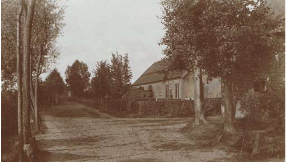
Het Begijnhof in de Broekstraat zo'n 80 jaar geleden. Rechts vooraan boerderij 'De Eik' met de afslag naar Groenendaal.