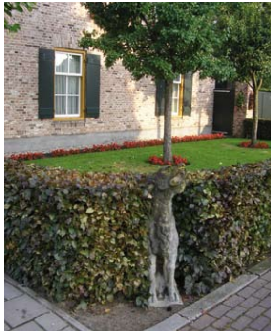
De wátterspawer in de héég!

De Gímmersse kéeërke hé án 't kléén torrentje óp 't priesterkoor ok 'n pár wátterspawers èn in de pastorie van Gímmert hebbe ze ok nòg 'nen hawtere bewaord,