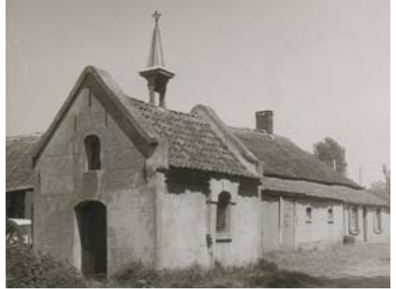
Het St.Tunniskapelletje schuin tegenover Hoeve Beverdijk (circa 1960).

opleverde moet voornamelijk worden volstaan met de tot dusver gegeven reconstructie. De bronnen in onder meer schepenprotocollen met vermelding van 'beverdijk' zijn na 1572 niet meer eenduidig. Tot laatstgenoemd jaar behoren de leenmannen van de hoeve Beverdijk tot de Brabantse landadel. Het is duidelijk dat in de roerige zestiende eeuw met zijn uitloop in de Tachtigjarige Oorlog, de laatste bekende adellijke leenman van Beverdijk in financiële problemen geraakte en uiteindelijk heeft moeten besluiten tot verkoop van de hoeve Beverdijk. De uitstraling van het leengoed zal dat niet ten goede zijn gekomen. Mogelijk heeft dat ook geleid tot een opsplitsing van het leengoed. Uit de zeventiende eeuw zijn tot dusver géén, en uit de achttiende twee niet-adellijke leenmannen bekend van de hoeve Beverdijk. 12 Op het minuutplan van het kadaster (1832) zien we overigens op de locatie waar de Beverdijk uitmondt op de Deel nog altijd een flinke hoeve (met een hoekwoning) en een kennelijke binnenplaats. Deze hoeve brandt in 1866/1867 tot de grond toe af. Datzelfde lot treft in 1954 ook de op de oude locatie nieuw opgetrokken boerderij. Sedertdien valt hier van een historisch interessante bebouwing in feite nauwelijks nog iets te bespeuren. De van de oude kern van Gemert wat afgeschei-