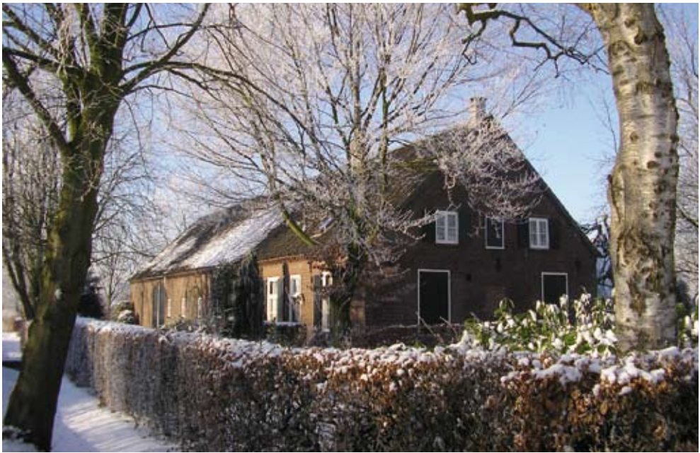
Hoeve 'Begijnhof' in januari 2009