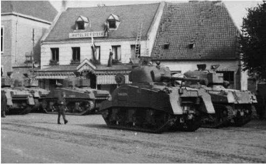
In Gemert gebeurde het! De hele herfst 1944 lag Gemert maar enkele kilometers van het front verwijderd.

huis onderdak wilden geven. Het leverde een extra inkomen op, maar vooral profiteerden de kwartiergevers van de voor hen luxe zaken van het leger als sigaretten, chocolade, zeep en rantsoenen. “Siggerèt for papa, sjoklat for mama”, was voor de plaatselijke jeugd het enige Engels geworden dat ze in die dagen kenden.