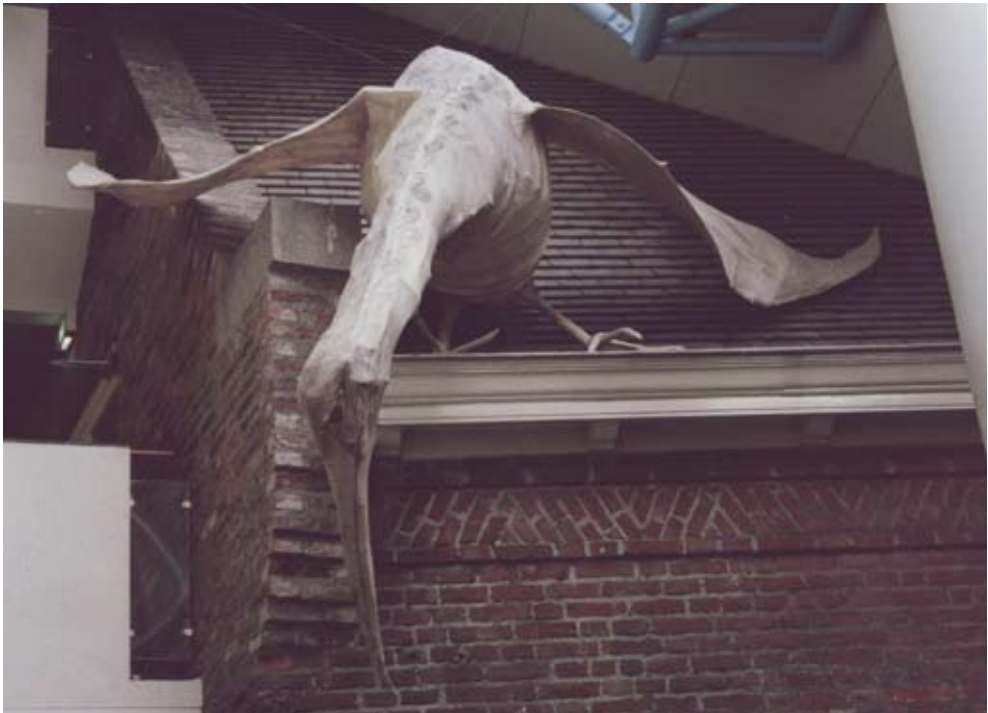
Buiten binnen 1985, ± 350 x 350 x 100 cm, hout, wilgetenen, gespannen papier