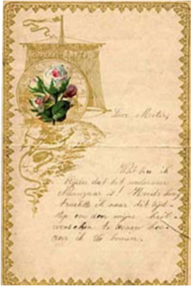
Nieuwjaarsbrief uit 1902: 'Lieve Meter, Wat ben ik blijde dat het wederom Nieuwjaar is! .....