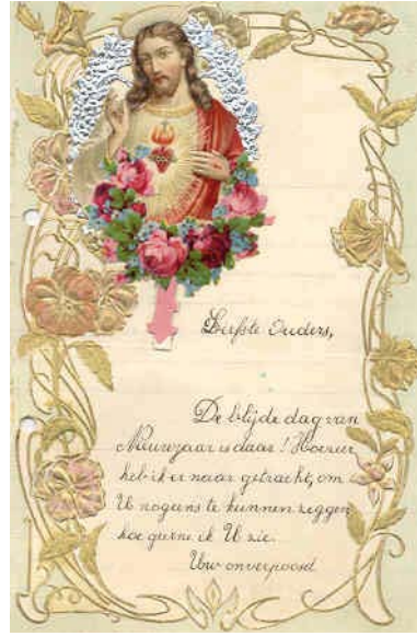
'Liefste ouders, De blijde dag van Nieuwjaar is daar. ....'

Voor de oorlog en in sommige streken van Zuid-Nederland tot in de jaren zestig, was het gebruikelijk om een Nieuwjaarsbrief te schrijven, gericht aan de ouders en grootouders. De brief schrijven was een onderdeel van het lesprogramma op de Lagere School. In België is dit nog steeds een gebruik en krijgen de kinderen een voorbeeldtekst aangereikt door de meester van de Lagere Schoolklas, inclusief mooi versierd briefpapier, dat overigens ook in de kantoorboekhandels te koop is. De brief wordt meestal in rijmvorm geschreven. In de boeken van Louis Paul