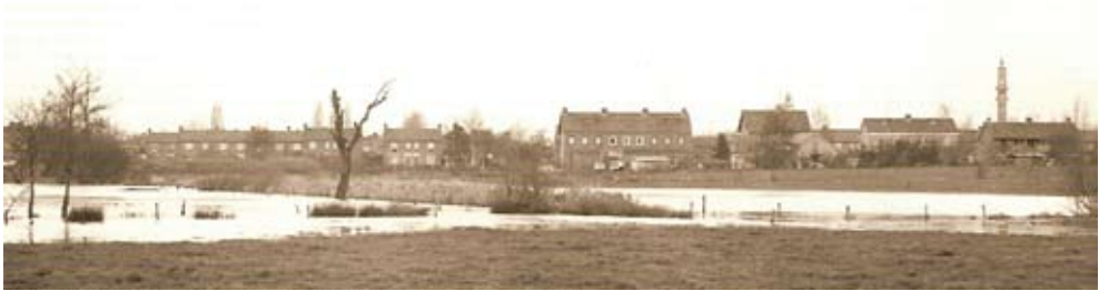
Al vóór de visvijver gegraven werd stond in menige winter 'de Dribbelel' blank (foto: Johan Claassen, 1975).

broek ligt dan meer voor de hand. Wel moest dan dwars door de langgerekte dekzandrug worden gegraven, waarover de doorgaande prehistorische route liep, die tegenwoordig Oudestraat heet. De naam Doregraaf is daarvan afgeleid: de Oudestraat en de hoge dekzandrug werd dóórgraven (dóórgegraven). Waar Doregraaf en Oudestraat elkaar kruisen