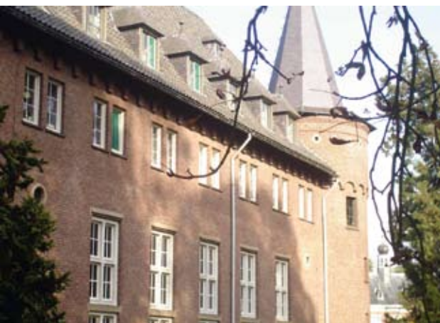
De na de verwoesting van 11 mei 1940 nieuw opgetrokken gevel van de voorburcht.

te ontsnappen. Hun tocht richting Beek en Donk werd waargenomen door een Duits vliegtuig dat gedurende een deel van het gevecht rondjes draaide boven het centrum van Gemert.