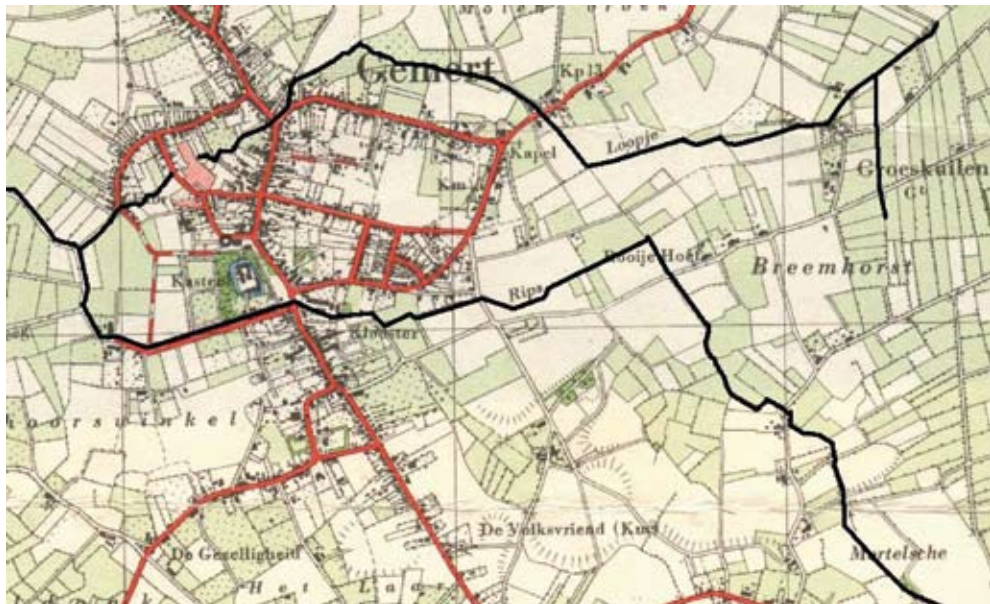
Figuur 1: Topografische kaart 1953 met daarop de beide Ripsen geaccentueerd.

De nadruk ligt daarbij op de aanpassing van het tracé van de natuurlijke waterlopen.