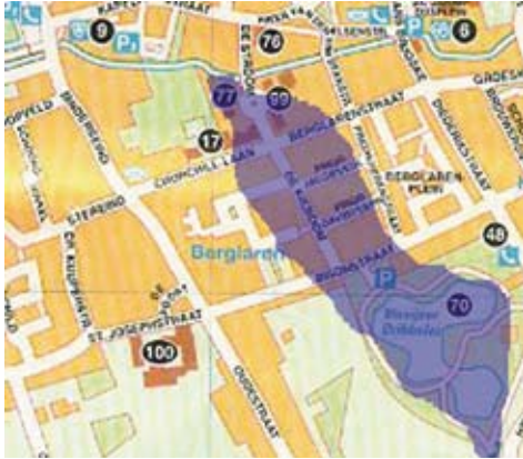
Figuur 3: Reconstructie die los van Schijndel maakte van het ven bij Dribbelei-De Stroom op grond van waarnemingen tijdens de recente bouwwerkzaamheden, geprojecteerd op het huidige stratenplan. Aan de bovenzijde de Kasteel-Rips.

in het verleden een grote waterpartij aanwezig was, die samen met het gebied van de huidige visvijver één geheel vormde. Ongetwijfeld werd De Beek gevoed met water uit dit voormalige ven. Dit voormalige ven ter hoogte van De Dribbelei werd gevoed door water vanuit de westkant van De Mortel. Van daaruit loopt een waterloop in noordwestelijke richting, door de Mortelse Paijen naar de Dribbelei. De plaats waar de waterloop de weg naar De Mortel kruist heeft van oudsher de naam De Stap, soms Kerkstap. Die naam duidt op een plaats waar de waterloop kon worden overgestoken. Denk hierbij aan de term 'stapstenen'. Op die plaats was kennelijk geen brug of duiker aanwezig, maar moest men doorgaans door het water 'stappen'. De