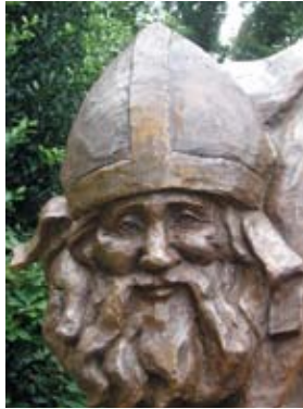
Hij licht glim en hij toost. Hij is echt 'krimmeneel'.

seerd of de vaandels werden uitgerold en in vol ornaat opgetrokken. In de meimaand (de Mariamaand bij uitstek) telde Handel op meerdere dagen duizenden bedevaartgangers en werden extra biechtvaders ingehuurd.