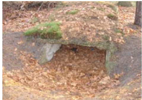
Geïmproviseerde kazemat op het landgoed Cleefswit (overzicht, voorzijde, achterzijde)