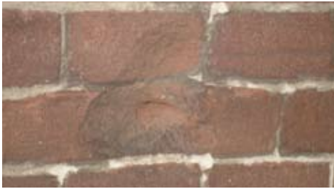
Kogelgaten in zijmuur van Hotel 'De Hoefpoort' (1+2+3).

en vooral geen vertier voor de gemobiliseerden. Om toch de tijd nuttig te besteden werden er veel marsen gelopen, veel gesport en veel stellingen gegraven. Drinkwater werd aangevoerd vanaf de zuivelfabriek in Gemert en vertier bood het muziekkorps dat werd opgericht. Stellingen moesten worden betrokken tussen een punt op 500 m ten noorden van het kruispunt Elsendorp en op 2,3 km ten zuiden