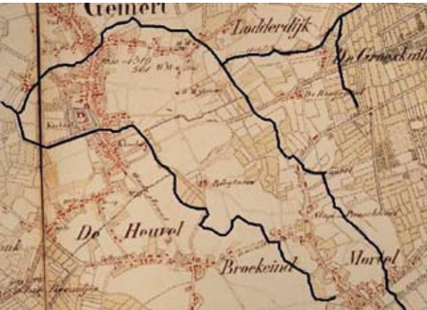
Figuur 4: Reconstructie van de oorspronkelijke, natuurlijke tracés van De Rips en De Beek. Eén van de zijtakken van De Rips, komend vanaf de Groeskuilen (Het Loopje) is ook aangegeven.

werd een 'aarden brug' aangelegd. We zouden dat tegenwoordig een duiker noemen. Alhoewel de Doregraaf vanaf de Oudestraat niet meer zichtbaar is, is hij nog steeds in zijn oude tracé aanwezig tot aan de huidige Zuidom. Het gevolg van het graven van de Doregraaf was niet alleen dat De Beek veel minder watertoevoer kreeg, maar dat de verbinding tussen Dribbelel en De Beek langzaam verdween.