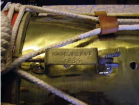
Inscriptie op de dieptrom van de Gemertse Knolskut.

trommend de feestzaal binnen te komen en als tamboer bij het gilde aan te blijven. Later werd hij zilverdrager en... in 2003 was hij het die zich tot koning van St. Joris schoot. Toon overleed op 31 oktober 2006. Hij kreeg een begrafenis met gilde-eer, een ware 'koninklijke' begrafenis, ook al was in de loop van 2005 zijn nicht Coby het koningszilver al omgehangen.