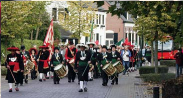
Fotoreportage van Willy Rovers op 13 oktober 2007 bij gelegenheid van Onthulling Klaïda.