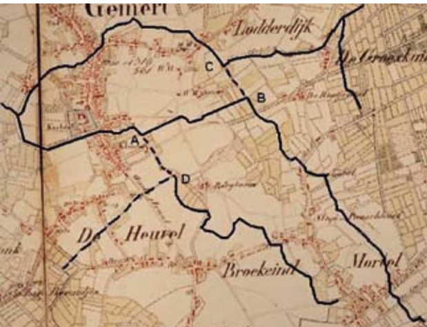
Figuur 2: Eerste chromotopografische kaart van Nederland van ca 1840 (collectie heemkundekring) als ondergrond. Beide armen van De Rips, de Doregraaf (onderbroken lijn) en de reconstructie van de oorspronkelijke tracés (onderbroken lijn) zijn geaccentueerd. Voor de toelichting en plaatsen A, B, C en D zie de tekst.

de kaart van ca 1840 wordt die waterloop aangeduid met de naam Het Loopje. Ook op andere kaarten komt die naam voor. De bovenloop van de Kasteel-Rips daarentegen heeft altijd de naam De Rips gehad. De conclusie is daarom dat Het Loopje van oorsprong een zijtak van De Rips was.