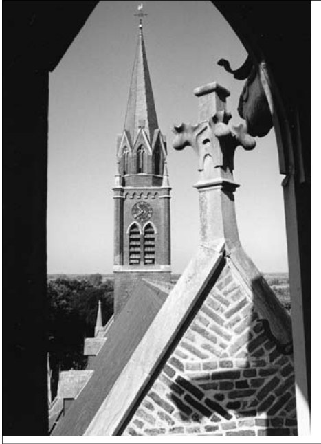
Daklijn van het kerkship op 100 Rijnlandse voeten!

plaats van in Maastricht aan de noordzijde. Maar daar is ook een aanwijsbare reden voor, want in Gemert komt op die plaats de naar het dorp gerichte gerfkamer (d.i. de oude sacristie).