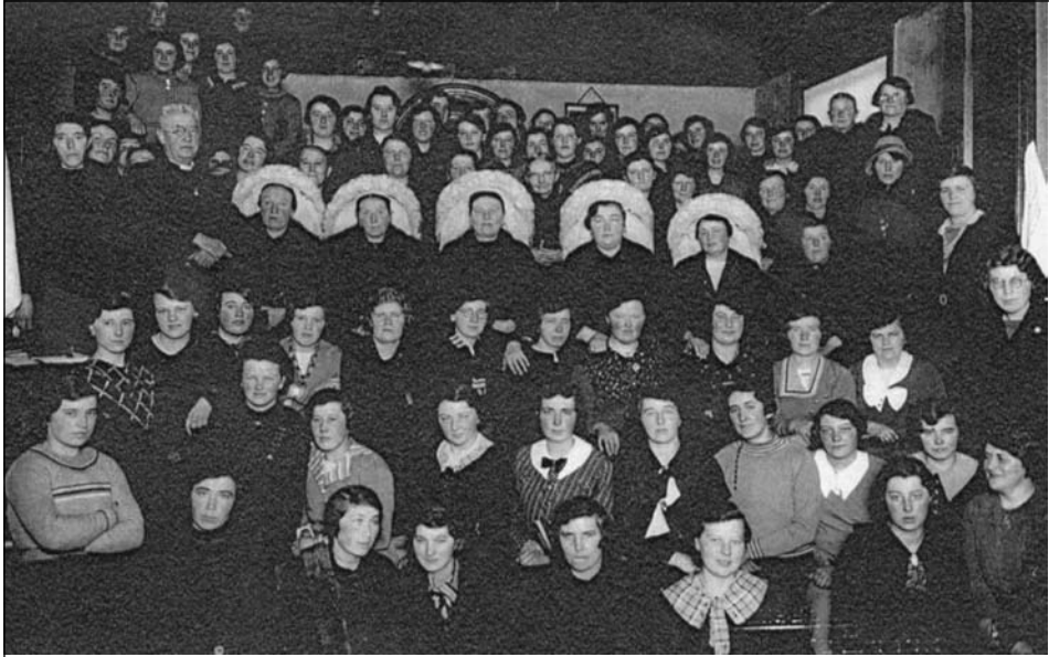
Groepsfoto in het Alcoholvrij Lokaal, 1935.

van de NCB wanneer hij ze had opgeroepen hun vrouwen of hun dochters te sturen. Toen op instigatie van het NCB-hoofdbestuur in het schooljaar 1926-1927 voor de eerste keer een landbouwhuishoudcursus (26 weken, drie dagdelen) voor jonge boerinnen werd georganiseerd hadden zich in Gemert slechts 14 boerenmeiden aangemeld terwijl Poell er zo'n 60 had verwacht. In zijn Kerkklokske reageerde hij die teleurstelling af met de vraag: 'Is het dan waar, dat de boer wel wil leren wat goed is voor het vee, maar dat 't er bij hen niet op aan komt, hoe de mensen worden bedaan?'