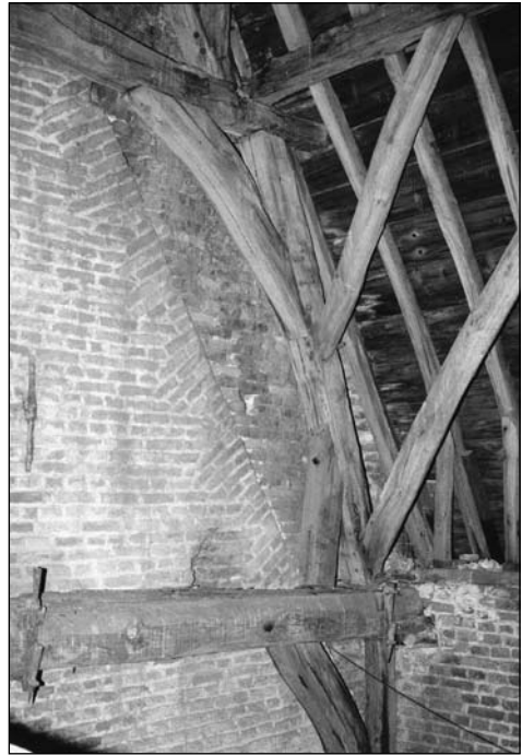
Op de gewelven: de westgevel van het priesterkoor gezien vanaf het middenschip. Duidelijk zichtbaar is de latere ophoging tot de daklijn van het middenschip.

De aan de middenschipzijde westelijke topgevel van dit priesterkoor wekt de indruk een tijdlang buitengevel te zijn geweest en wel tot het moment dat het iets hogere middenschip werd aangebouwd.