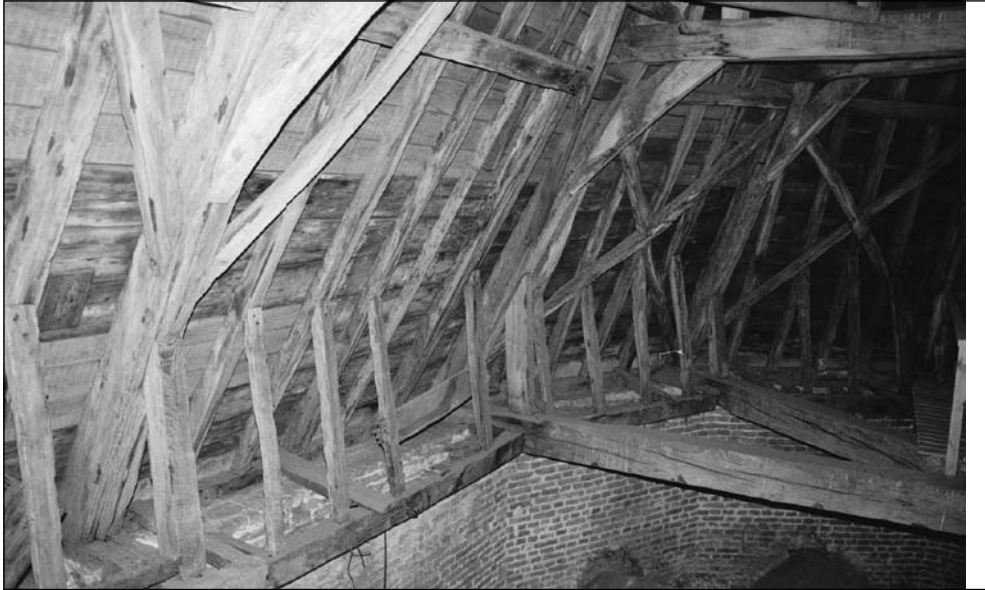
Op de gewelven: Zicht op de dakconstructie van het priesterkoor. Onder, nog juist zichtbaar, twee gewelfbogen van de polygonale sluiting van het koor. Goed is te zien dat de kruin van het koorgewelf ruim beneden de hoogte der muren blijft.

in hoeverre een aanvullend degelijk bouwhistorisch onderzoek de hier geuite oplossingen van de mysteriën van de Gemertse gewelven zullen schragen.