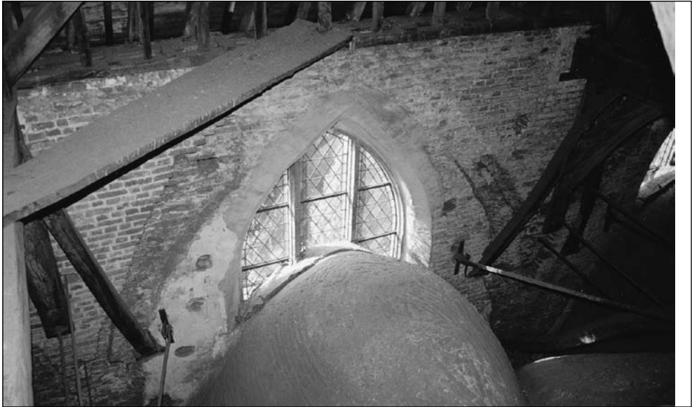
Op de gewelven: middeleeuwse gewelfboog rustende op een schalk halverwege het negentiende-eeuwse venster van het middenschip. De schepping van Cuypers! Goed zichtbaar is de uitgehakte uitsparing voor een hoger aan te brengen gewelf. Maar wie verklaart de pleisterlaag links van het raam?

middenschip - op een veel lagere hoogte dan men gezien de ruimte onder de kap mag verwachten - tot die vijftiende-eeuwse budgetaire omstandigheid is terug te voeren. In de gotiek is het doorgaans zo, dat de kruin van de gemetselde gewelven reikt tot de hoogte van de muren, terwijl die in Gemert daar wel heel ruimschoots onder blijft. Iedereen die de gewelven van het Gemertse middenschip betreedt is daarom ook meteen verrast door de lichtinval van hoge buitenramen (boven) op die gewelven. Kent u één kerk waar de gemetselde gewelven rusten op schalken halverwege de buitenramen van het mid-