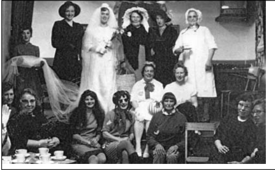
Modeshow in de patronaatszaal

de vlag van Sint Amelberga dat kon ze niet over haar hart verkrijgen. Een nagemaakte flutvlag kon diejen