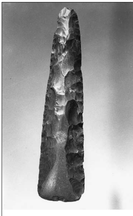
Gepolijste vuurstenen bijl gevonden op 'de Vossenberg': 5000 jaar oud!

Op de Heibloem in Bakel, aan de rand van het peelgebied, werd de éérste vuistbijl van Noord-Brabant gevonden.