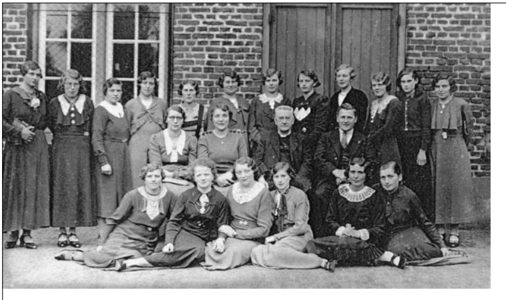
Geslaagden met docenten (middelste rij), 1936.