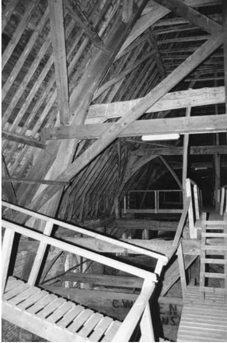
Op de gewelven: Zicht op de dakconstructie. Op de voorgrond de 19de-eeuwse spanten, daarachter de middeleeuwse eiken gebinten. N.B.: Het dakbeschot aldaar dateert blijkens een inkerfing uit 1723.

begrepen gothische vormen' liegt er niet om. Het kerkgebouw heeft gezien vanuit het noorden, in haar verlenging (met 19,05 meter!) inderdaad een te lang schip met een wel erg iele kerktoren gekregen. Naar onze mening is vanuit 'het vrije westen' (vanaf het kerkhof) diezelfde kerktoren overigens evengoed majestueus oprijzend te noemen.