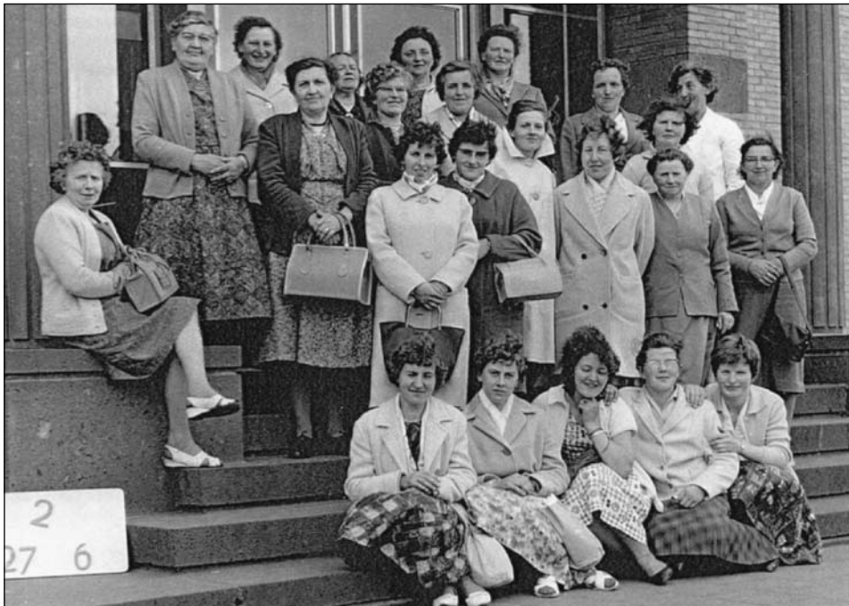
Op excursie bij De Gruijter in Den Bosch

De activiteiten van de boerinnenbond hadden op het eerste gezicht een nogal traditioneel karakter. De cursussen waren er op gericht de deelnemers vooral te leren een betere huisvrouw, moeder, echtgenote, en platte-