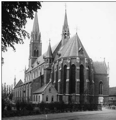
De kerk vanuit het oosten - kort vóór de bouw van de pastorie (1935) - met (nog) vrij zicht op de sacristie van Van Tulder en het middeleeuwse traptorentje dat voert naar het gewelf van het priesterkoor.

Eenzelfde verschil in degelijkheid ziet men ook in de gebinten. Zware gekapte eiken gebintconstructies met gat- en penverbindingen, tegenover machinaal-strak gezaagde grenenhouten spanten. Over Van Tuldere werk wordt nog al eens