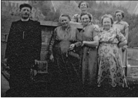
Vroeger ging één keer per jaar het bestuur met de geestelijk adviseur op stap.