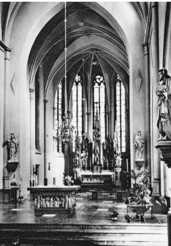
Achter de triomfboog begint het priesterkoor. In de gewelven daarvan zijn sluitstenen zichtbaar (foto circa 1970).

1462 tot zijn overlijden in 1482 en dat hij in Gemert de 'stichter van de Choor' was. Deze laatste zinsnede is geïnterpreteerd als 'bouwheer van het priesterkoor', terwijl het in werkelijkheid gaat om de stichting van een uit koorpriesters bestaand kerkkoor, dat status moest geven aan de commanderij Gemert. Over de stichting van dat kerkkoor - van hymnenpriesters tot hennen-