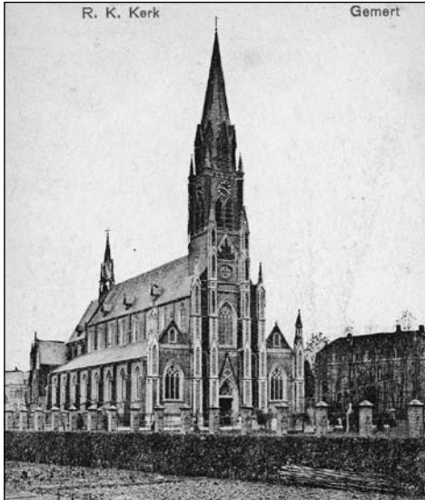
De Gemertse kerk, circa 1920.

ren. De ramen werden heropend en met gekleurd glas voorzien en de muren werden gepolychromeerd. Dit laatste werk werd in 1869 tot het overige gedeelte der kerk uitgestrekt. De uitvoering dezer polychromering werd toevertrouwd aan Van den Boer te Veghel. (...)