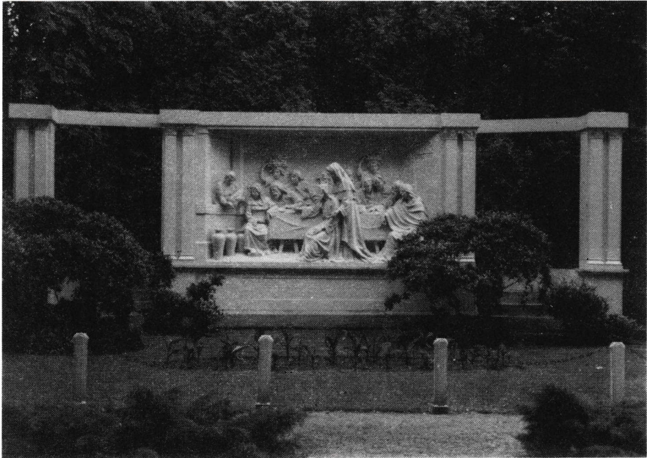
De bruiloft van Kana.

sche vorm, vervaardigd door Van Balgoy uit Nijmegen. Bij gelegenheid van het zevende eeuwfeest in 1922, werd een grote beeldengroep in hoog reliëf, voorstellende de "Bruiloft van Canaän", geplaatst op de plaats waar tot 1906 de hoeve "het Zwart Cruijs" stond.