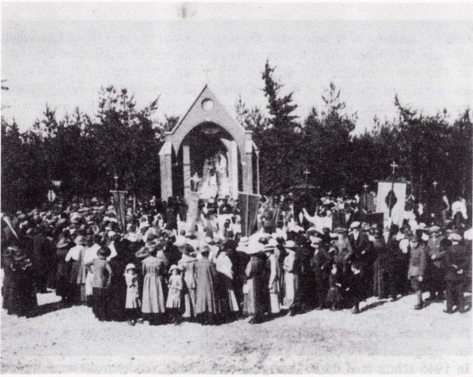
Een eredienst bij de Benedictiekapel tijdens een processie in het park.

Met de aanplant van 68 iepen en 78 lindebomen werd vervolgens het project van Rector Van de Laarschot voltooid. De totale kosten van de processieweg met de kapelletjes beliepen zo'n f 6.500,00, die volledig uit giften konden worden betaald. Voor die prijs kon toen een gemiddelde boerderij gebouwd worden. De giften waren voornamelijk afkomstig van Helmondse en Beek en Donkse industrieëlen zoals Van Thiel, Prinzen en Van Asten. Eén kapelletje werd geschonken door de Tilburgse processie.