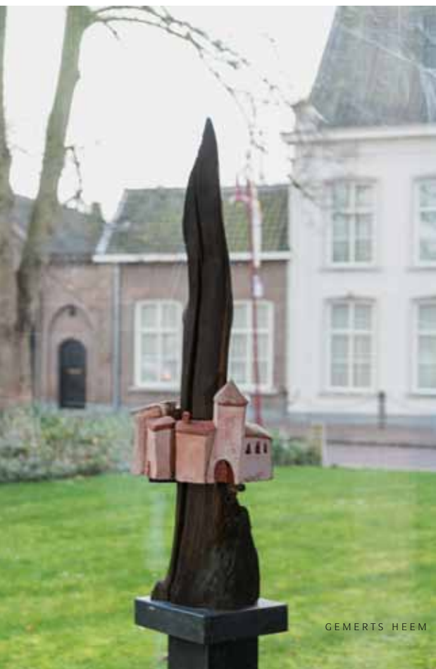
Een kunstwerk met een 686 jaar oude paalpunt: Gemerts Erfgoed!

Vries uit 2012. De eikenhouten paal waaraan het keramische gebouwcomplex is opgehangen, is gevonden bij de grote archeologische opgraving van het hooghuis in 1996. Het is een paalpunt van één van de tweeëntwintig gevonden pijlers van de brug die over de gracht leidde naar het Hooghuis op de motte van de adellijke Van Gemerts. Dendrologisch onderzoek heeft deze paalpunt gedateerd op het jaar 1330. Het kunstwerk is zichtbaar vanuit de archieftuin waarin ook andere met lokale historie beladen ‘corporele documenten’ een plaats hebben gekregen.