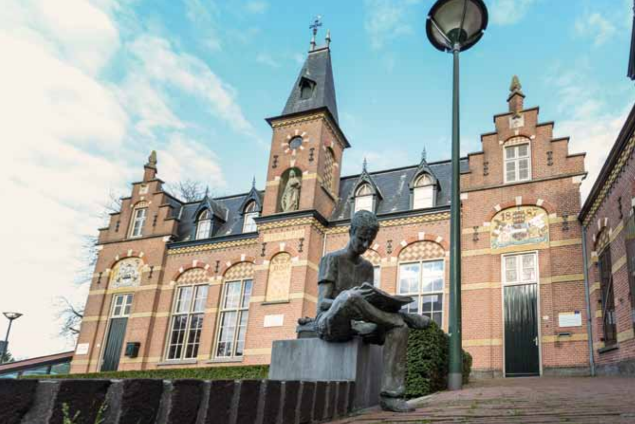
Historisch Informatie Centrum Latijnse School