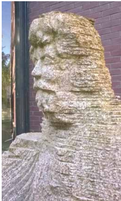
Het edele hoofd van de 'Unvollendete Grassens'

dium hoort toe aan de bezitter. Veel allodia vinden hun oorsprong in een rijks- of koningsgoed, dat door de vorst wegens bewezen diensten aan een trouwe vazal wordt geschonken, waarbij het statuut van allodium ten eeuwigden dage gehandhaafd blijft. In wezen hoort het allodium ook niet meer tot het vorstendom waaruit het is voortgekomen. 'Boven een allodium staat alleen God en de Zon' . Hoe de familie Van Gemert aan het allodium-Gemert is gekomen, is onbekend.