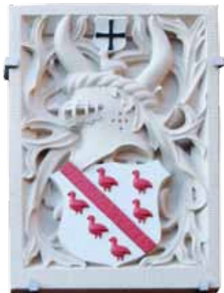
Een heraldisch curiosum: 500 jaar verschil!