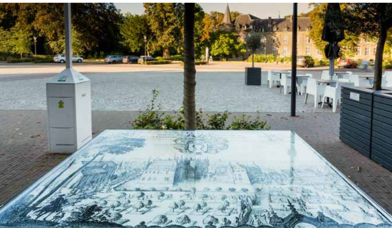
RESIDENTIE VORSTENDOM GEMERT ANNO 1700. ROMEIN DE HOOGHE

Doe het maar eens na! De residentie op tafel!