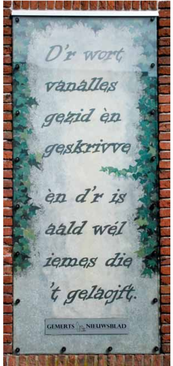
Zeventienhonderd jaar geleden landt bij de bisschopsverkiezing van Ravenna een duif op het hoofd van de wever Severus: een teken van de H.Geest. Hij wordt bisschop. Aan zijn voeten zit een Gemertse kanarie in een kooitje. De Gemertse wijsheid hiernaast is gesponsord door Gemerts Nieuwsblad. Met dank!