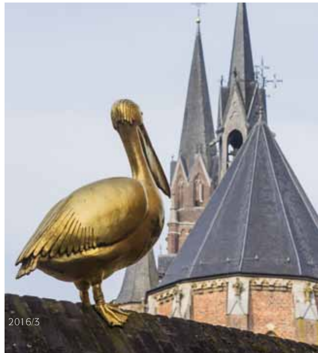
De gouden pelikaan: meteen Gemerts Erfgoed

bezit van een door kruisvaarders meegebrachte relikwie van het Heilig Kruis maakt het meteen tot pelgrimsoord: die Capelle vant heilich Cruys van Miracul . In 1437 is dit de eerste parochiekerk van Gemert en de bouw van de nieuwe kerk daartegenover kan voor een niet onbelangrijk deel bekostigd worden uit de offergaven bij 't heilich Cruys . Na de ingebruikname van de nieuwe kerk (1455) krijgt de voormalige kapel de bestemming van herberg en brouwhuis " In die Olde Kercke ". Rond 1662 staat er op hetzelfde perceel nōg een herberg en die draagt de naam " De Pelikaan " (nu: Ridderhof). En er is een direct verband tussen de pelikaan en de gekruisigde Christus: in tijden van nood pikt de pelikaan tot bloedens toe in zijn borst, om - aldus de legende