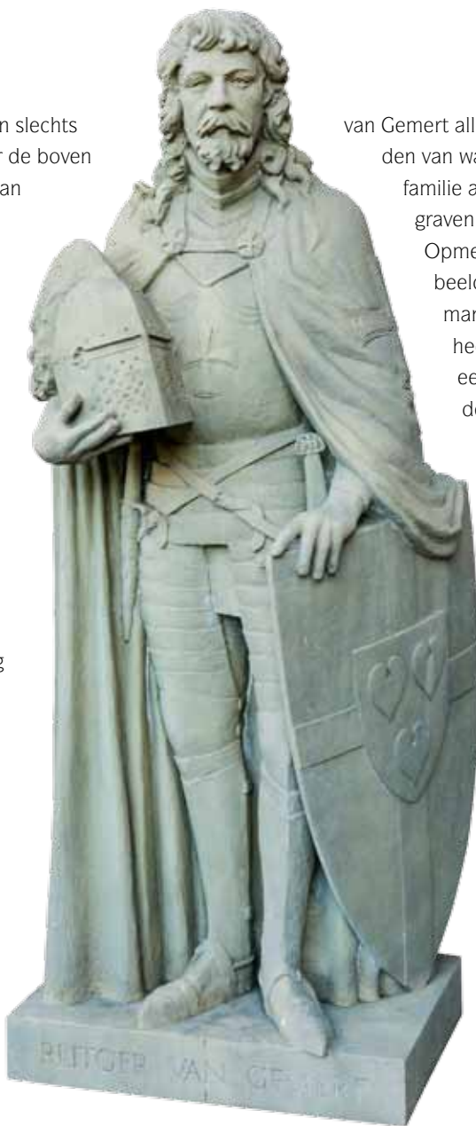
Edelman Rutger van Gemert

die vroege periode bestaan slechts heel weinig bronnen. Maar de boven water gekomen fundator van de Vrije Commanderij is voor de vroegste geschiedenis van Gemert van wezenlijk belang. Een uitgangspunt dat vastigheid biedt. Een gegeven ook dat beeldhouwer Toon Grassens al meteen in de jaren tachtig van de vorige eeuw inspireert om in zijn spaarzame vrije uurtjes deze 'grote zoon van Gemert' levensgroot te modelleren in een vroeg dertiende-eeuws harnas. Hij maakt het beeld van polyester met de bedoeling het te zijner tijd te laten dienen als model voor een te maken beeld in graniet. Maar ook het kunststofbeeld bewerkt Toon zodanig dat het een uitstraling krijgt van een stenen beeld van een kleine duizend kilo. In de zomer van 1996 verrast Toon de archeologen en een groot belangstellend publiek door zijn mobiel ridderbeeld kant en klaar te zetten boven op de berg naast de opgravingen van het Hooghuis, zodat Rutger