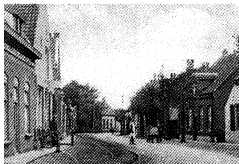
De Haageik in vroegere tijden. Ooit stond aan de linkerkzijde het oud(st)e gasthuis van Gemert.