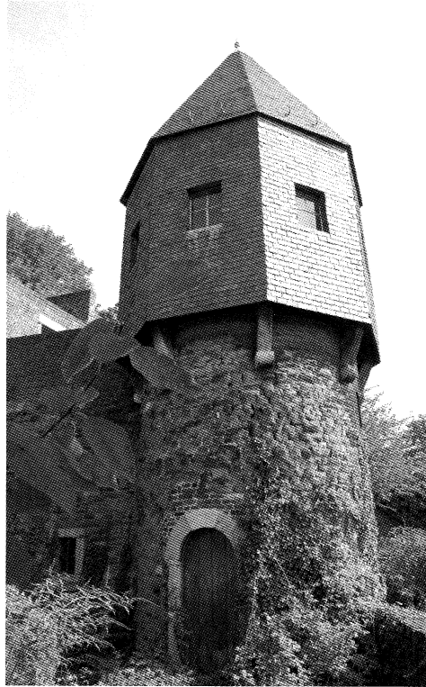
In dit torentje, gebouwd tegen de wand van de citadel van Luik, hadden de uit Gemert afkomstige groot-pastors hun werkkamer.