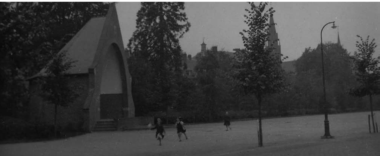
De kiosk op Gemerts 'Mertveld' (opname circa 1938)

In Amsterdam bracht ik de toehoorders een gebouw onder de aandacht dat we daar – Rijksmuseum en Paleis op de Dam en Olympisch Stadion ten spijt – absoluut niet hadden, maar in Gemert wél! Het kasteel! En als ik dan beschreef hoe het eruit zag, dan was de finishing touch dat het kasteel ook een ondergrondse vluchtgang had. Jazeker! En dat je die gang nog helemaal door kon wandelen, en als je uiteindelijk bovenkwam, dat je dan