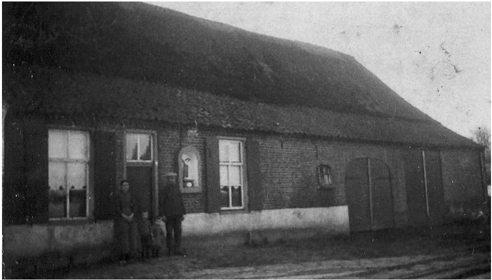
De oude Michaelhoeve in de Pandelaar. In de nis zien we het beeldje dat thans in de kerk staat boven de deur van het priesterkoor naar de sacristie. De foto, met op de voorgrond de tramrails, dateren we circa 1932.