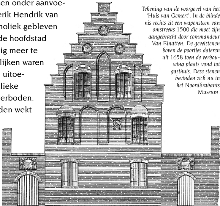
Tekening van de voorgevel van het 'Huis van Gemert'. In de blinden nis rechts zit een wapenstein van omstreeks 1500 die moet zijn aangebracht door commandeur Van Einatten. De gevelstenen boven de poortjes dateren uit 1658 toen de verbouwing plaats vond tot gasthuis. Deze stenen bevinden zich nu in het Noordbrabantse Museum.

het dorp en de vrijheerlijkheid van Gemert, als gemachtigde van Caspar Ulrich van Hoensbroeck, ridder der Duitse Orde en commandeur van Gemert, het huis van Gemert zien verkopen aan Peter Wouterzoon Donck, luitenant-wachtmeester en ondermajoor van Den Bosch. 2 Twintig jaar later verkocht de weduwe van deze Peter Donck het huis aan de Fundatie van Hester van Grinsven waarna het pand werd verbouwd tot gasthuis, of beter gezegd twee gasthuizen, waarvan één werd bestemd voor zeven