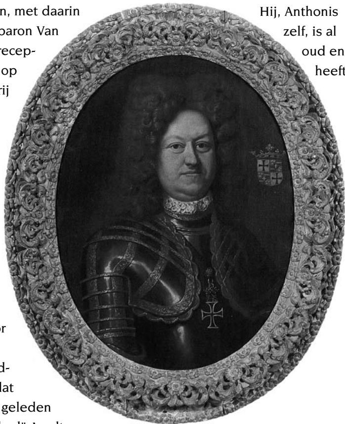
Geschilderd portret van landcommandeur Hendrik van Wassenaer, aangebracht op een schouwpaneel in de hoofdburch van Alden Biesen.