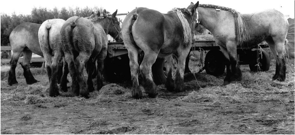
Op de Gemertse Paardenfokdagen zijn er altijd veel 'mouwie geklaojfde konte' te zien. (Gemert 1995)

o ev: mos. Haj h e m s  n de kaojte : hij is rijk, heeft veel land. (Al eerder heb ik soortgelijke uitdrukkingen met  erd en r s gepubliceerd).