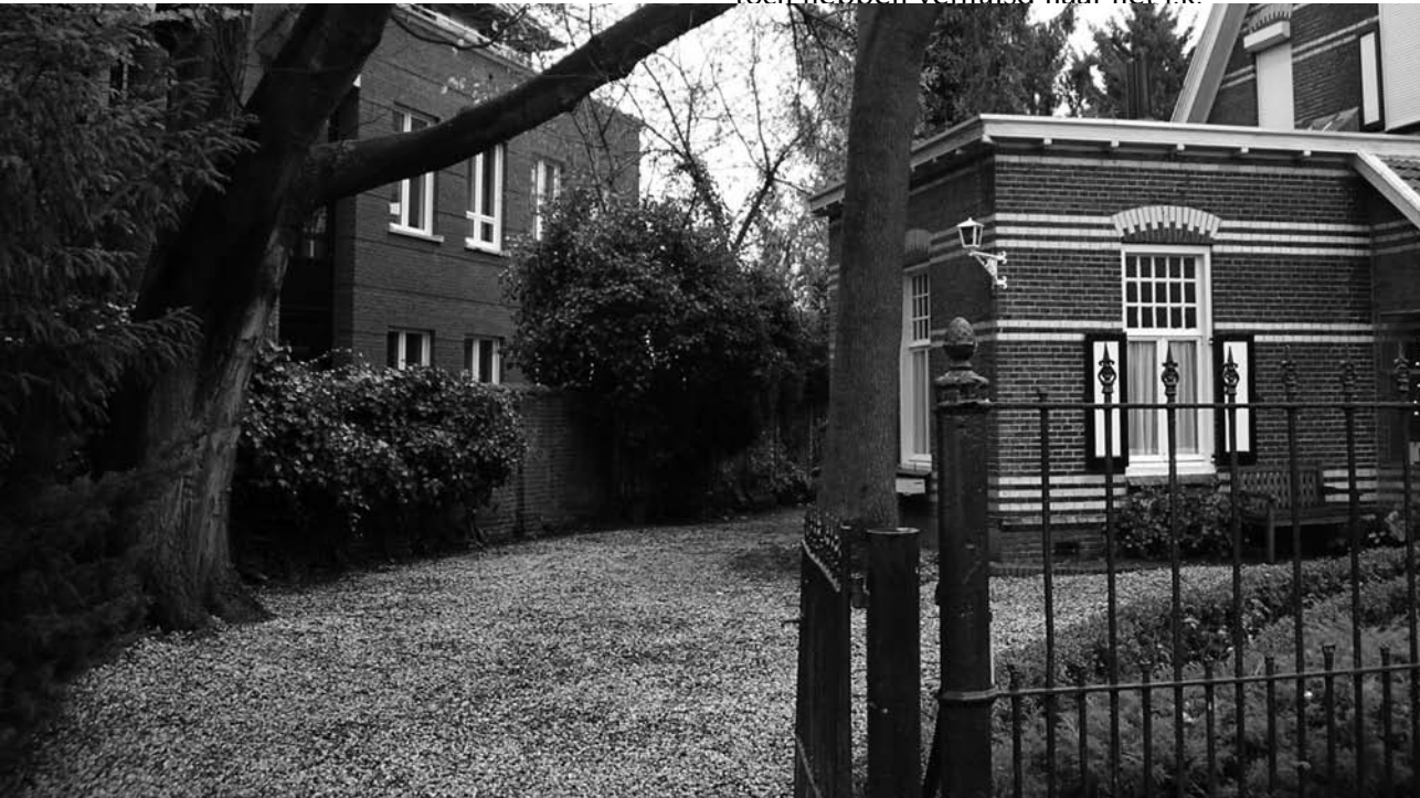
Het geuzenkerkhof aan het Binderseind? "Jao daor laoge ze. An de muur tígge de Ríps!"

ligt dus voor de hand dat die geraamtes niet van de Gemertse predikheren zijn maar van de Gemertse geuzen. En... het zou me niet verwonderen dat bij een zorgvuldig doorneuzen van de Gemertse begraafboeken we er op termijn ook nog wel achter komen wie er hier zoal begraven zijn. En mag dan blijken dat er ter plaatse toch ook enkele predikheren zijn begraven, dan lijkt het me haast zeker dat ze die op zeker moment toch hebben verhuisd naar het r.k.