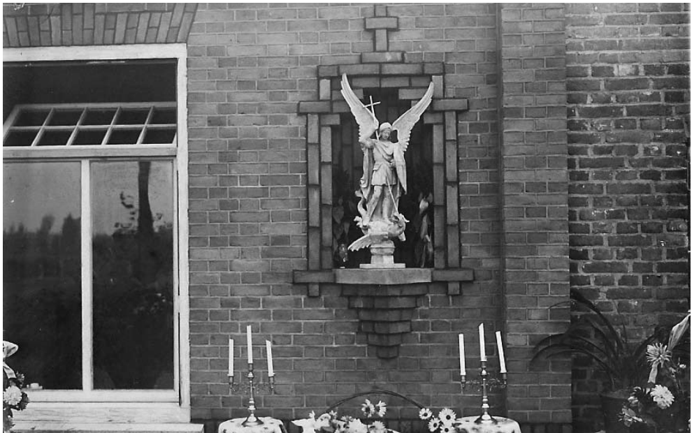
Het Michaelkeske in de nieuwe boerderij bij de inzegening in oktober 1933.