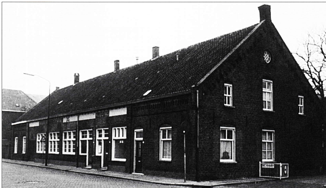
Voormalige boerderij en woning (1901). Foto: circa 1985.

Kort nadat de congregatie in 1855 de naam van Vereeniging aannam, is alle bezit daarop overgeschreven. Gemert volgde zoals gezegd met deze wettelijke inschrijving, al werd de tenaamstelling van de eigendommen niet gewijzigd. Dat zou pas in 1933 gebeuren, en wel op grond van het recht van verjaring. Waarom dat niet eerder is gebeurd, kon niet uit de beschikbare archivalia worden opge maakt.