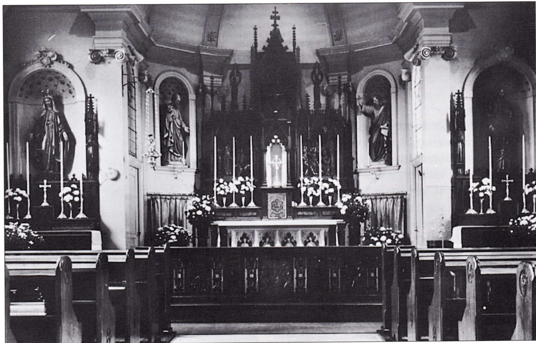
Interieur van de kapel in de jaren vijftig.

In de verwachting dat na het vertrek van de Fransen uit Noord-Brabant in 1814 de druk op het voortbestaan voorbij was, kwam men bedrogen uit. Vooruitlopend op het herstel van de nationale soevereiniteit werden verscheidene kloosters in oostelijk Noord-Brabant (de voormalige zelfstandige enclaves), die na de inlijving in 1810 bij het Franse keizerrijk waren opgeheven, weer betrokken. Hoewel koning Willem I alsook zijn protestantse raadsleden dachten in de geest van de Franse wetgeving, lieten zij deze situatie in zoverre ongemoeid, dat niet tot gedwongen ontruiming werd overgegaan, om het katholieke volksdeel, met name met het oog op de aansluiting van de zuiderburen, niet meteen voor het hoofd te stoten. Hoewel bij Koninklijk Besluit van 2 september 1814 werd bepaald dat de opheffing van kracht bleef,