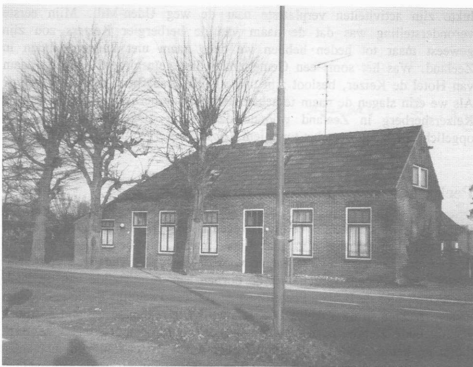
De huidige Peelsche Hut onder Zeeland